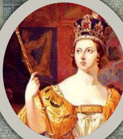
Виктория Alexandrina Victoria