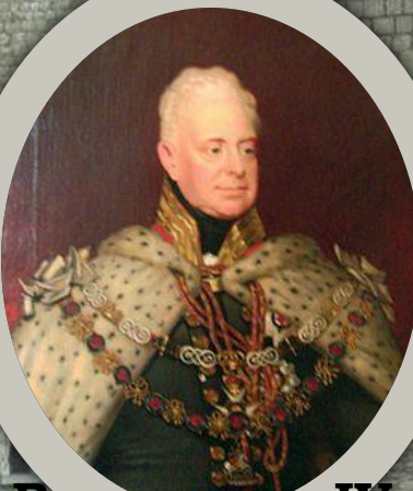
Вильгельм IV William Henry