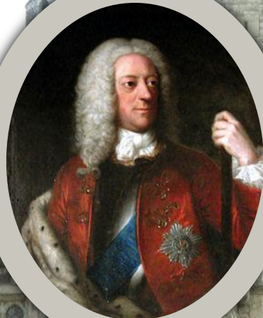
Георг II George II August