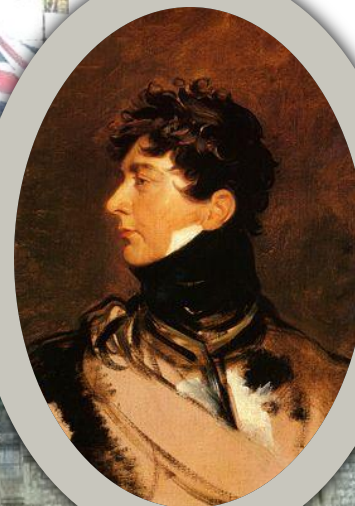
Георг IV George IV