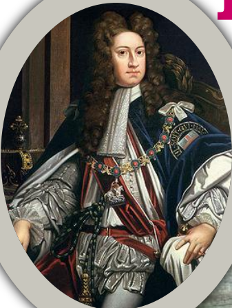
Георг I Georg Ludwig von Hannover