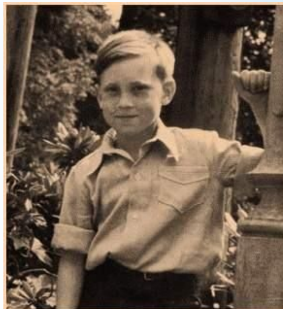
г.Бад Эльстер, Германия, 1948 г.