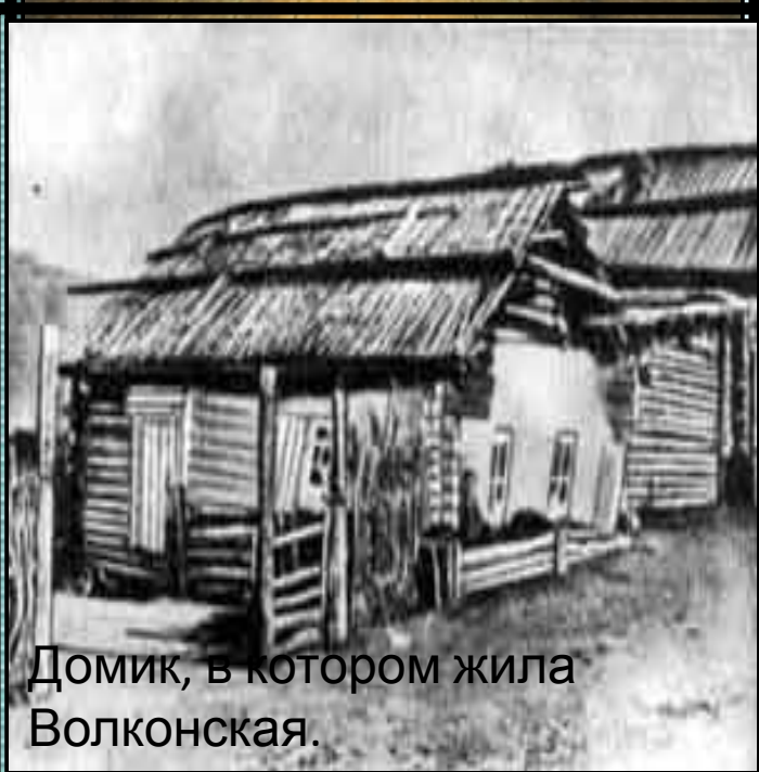
Домик, в котором жила Волконская.

Вот как вспоминает свою жизнь в каземате Мария Волконская: "Самое нестерпимое в каземате было отсутствие окон. У нас весь день горел огонь, что утомляли зрение. Каждая из нас устроила свою тюрьму, по возможности, лучше; в нашем номере я обтянула стены шелковой материей (мои бывшие занавеси, присланные из Петербурга). У меня было пианино, шкаф с книгами, два диванчика, словом, было почти что нарядно».