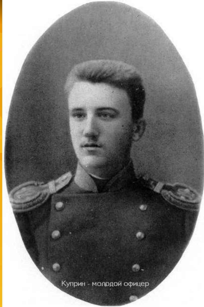
Куприн - молодой офицер