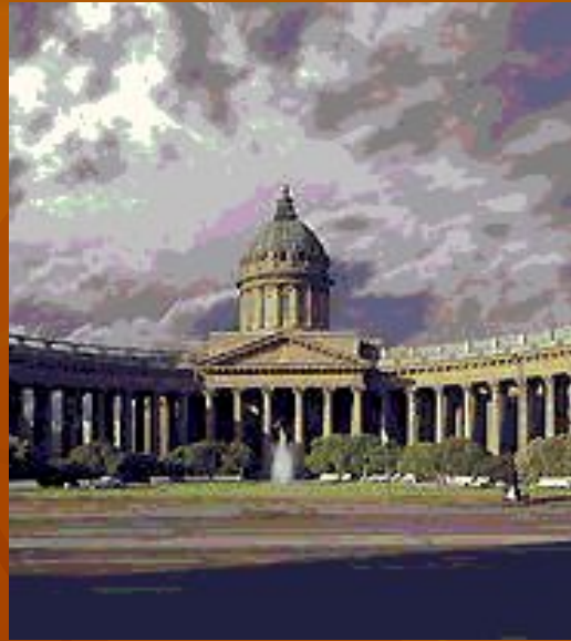
Казанский собор Санкт-Петербурга. Здание собора является монументальным памятником архитектуры русского ампира (архитектор А. Н. Воронихин).