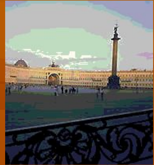
Александровская колонна (или «Александрийский столп») — памятник победы русского народа в Отечественной войне 1812 года — была установлена в 1830-34 (архитектор А. А. Монферран) и названа в честь императора Александра I.