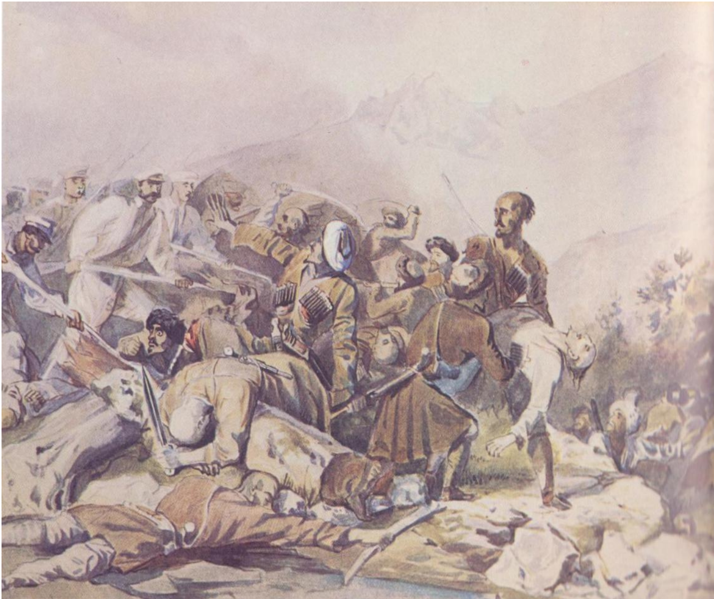
Эпизод из сражения при Валерике. Рисунок. 1840