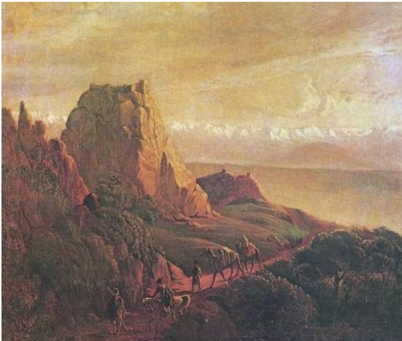
Окрестности селения Караагач. Масло.1837-1838