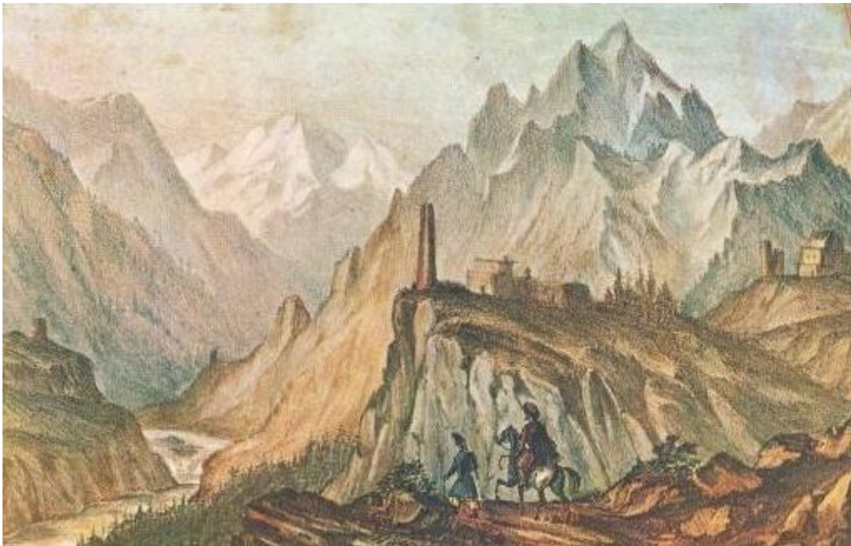
Вид Крестовой горы. Автолитография. 1837-1838