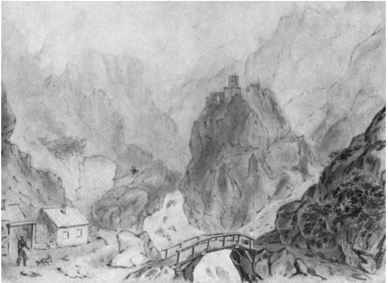
Дарьяльское ущелье с замком царицы Тамары. Карандаш. 1837