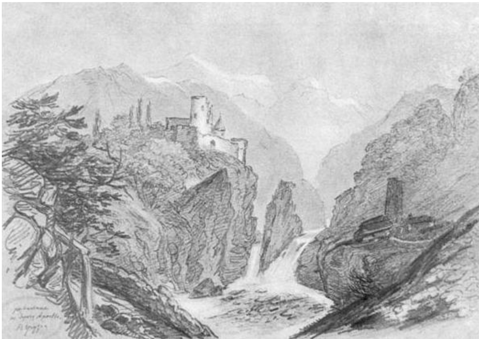
Развалины на берегу Арагвы и Куры. Карандаш. 1837