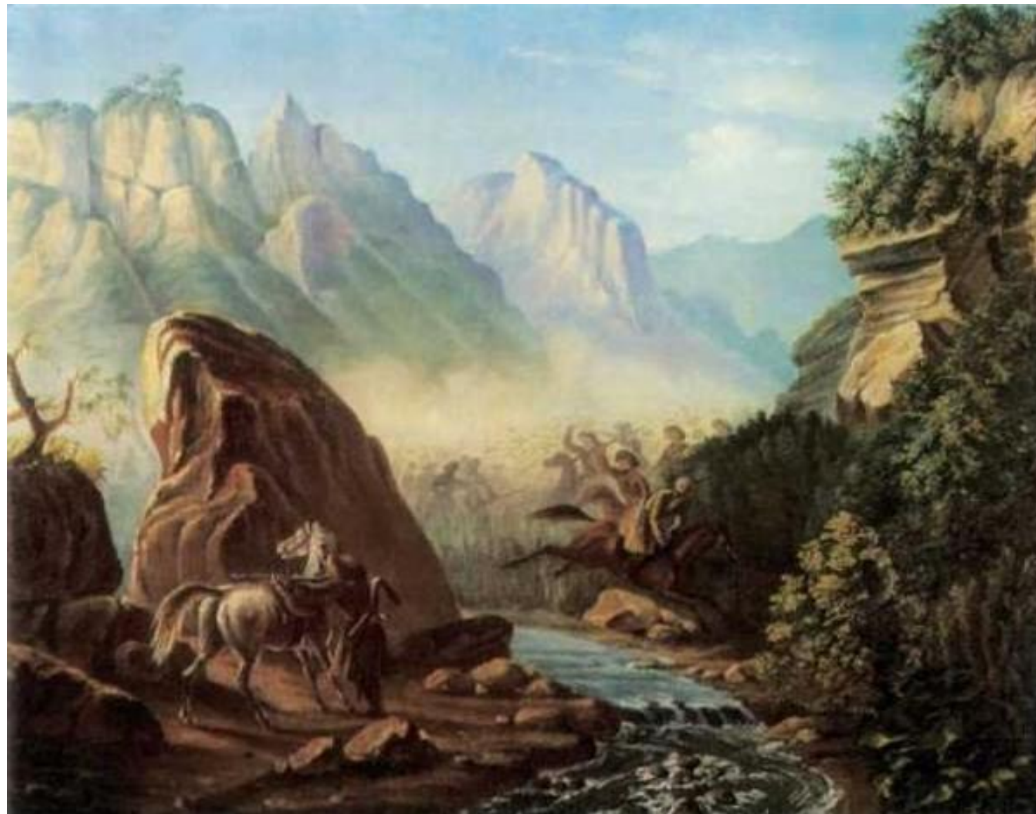
Перестрелка в горах Дагестана. Масло. 1840-1841