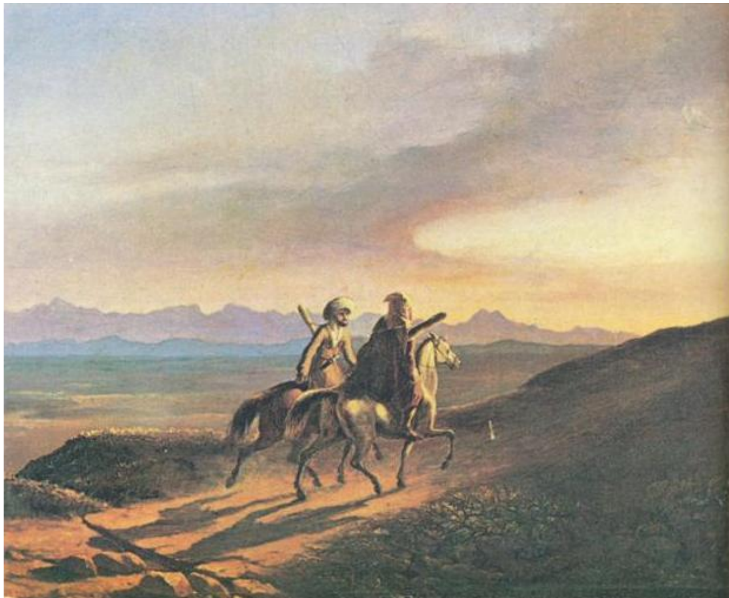
Воспоминания о Кавказе. Масло. 1838