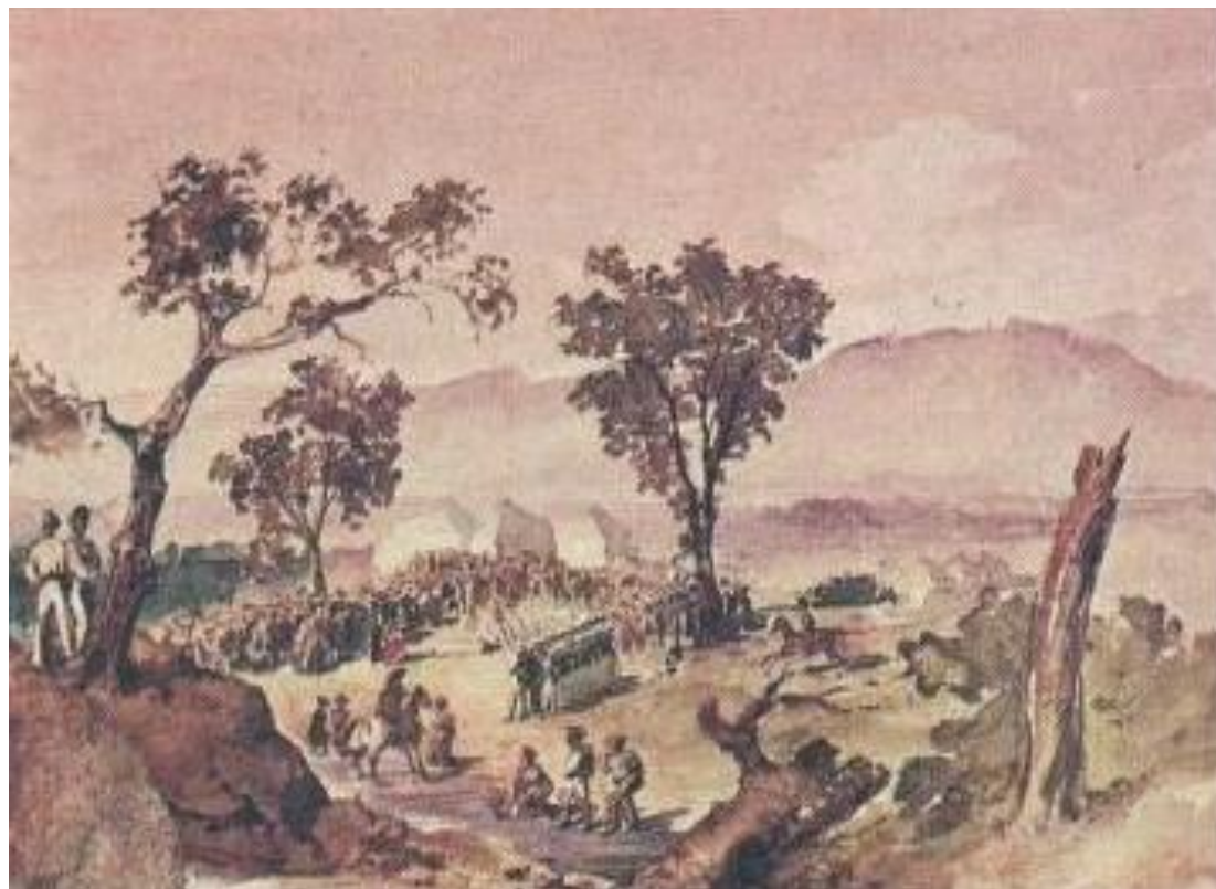
При Валерике. Похороны убитых. Акварель. 1840