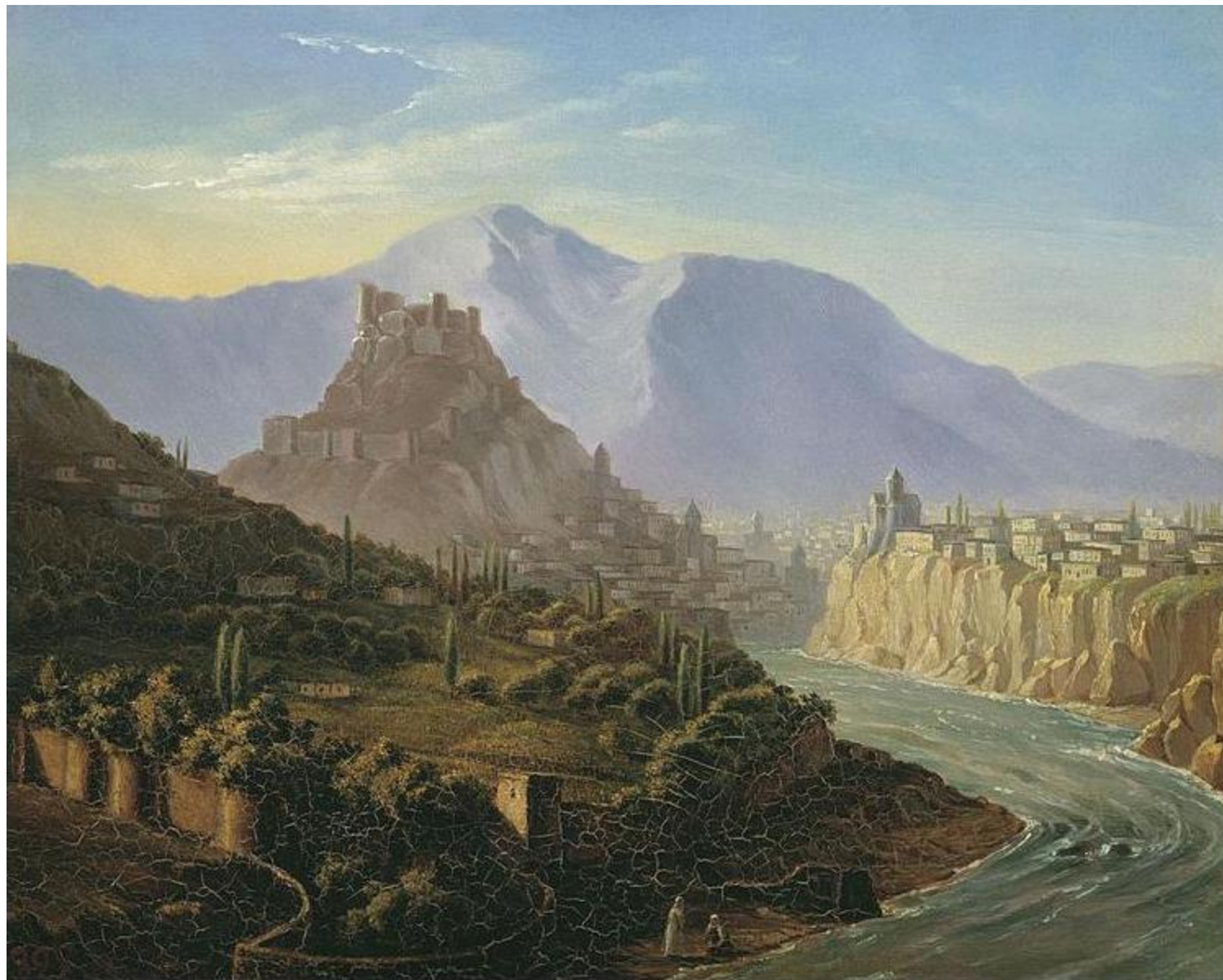
Вид Тифлиса. Масло. 1837