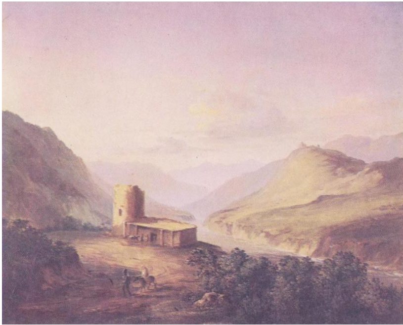
Военно-Грузинская дорога близ Мцхеты. (Кавказский вид с саклей).

«Он <Лермонтов> охотно прислушивался к рассказам старожилков и часами сидел за альбомом, набрасывая поразившие его картины природы. У А.А.Краевского находится картина масляными красками, изображающая место действия «Мцыри», на берегу Арагвы. Эта картина была снята Лермонтовым с натуры».