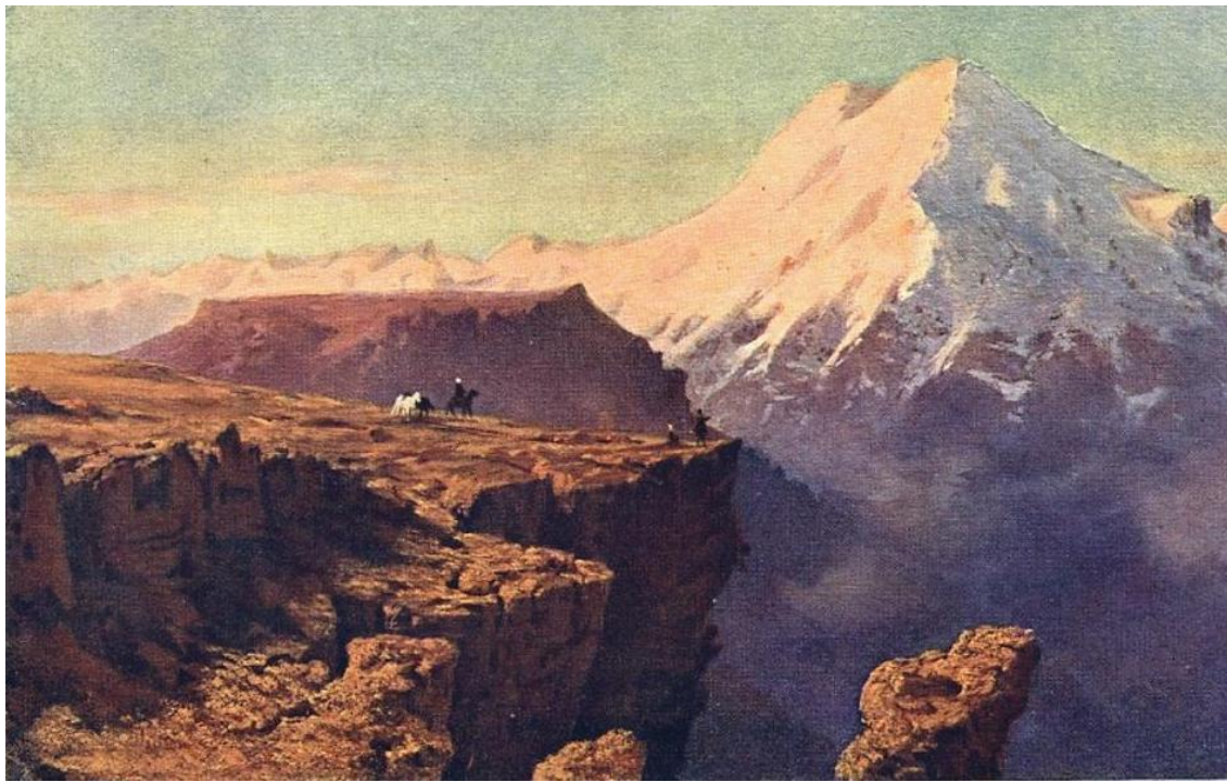
Кавказский вид с Эльбрусом.

Из письма Лермонтова: «У меня здесь очень хорошее помещение; каждое утро из своего окна смотрю на всю цепь снежных гор и на Эльбрус; вот и теперь, сидя за письмом к вам, я по временам кладу перо, чтобы взглянуть на этих великанов: так они прекрасны и величественны!». (М. Ю. Лермонтов – М. А. Попухиной. 31 V 1837 (Лермонтов, изд. „Academia“, т. V, стр. 543).