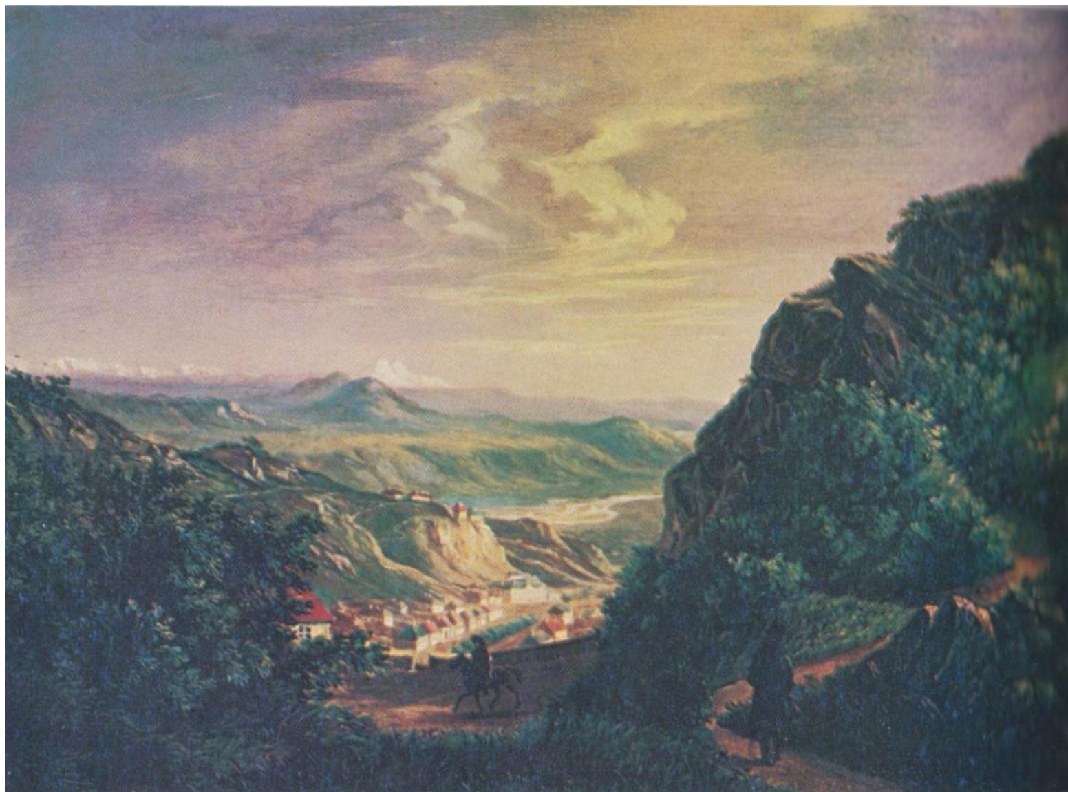
Вид Пятигорска. Масло. 1837