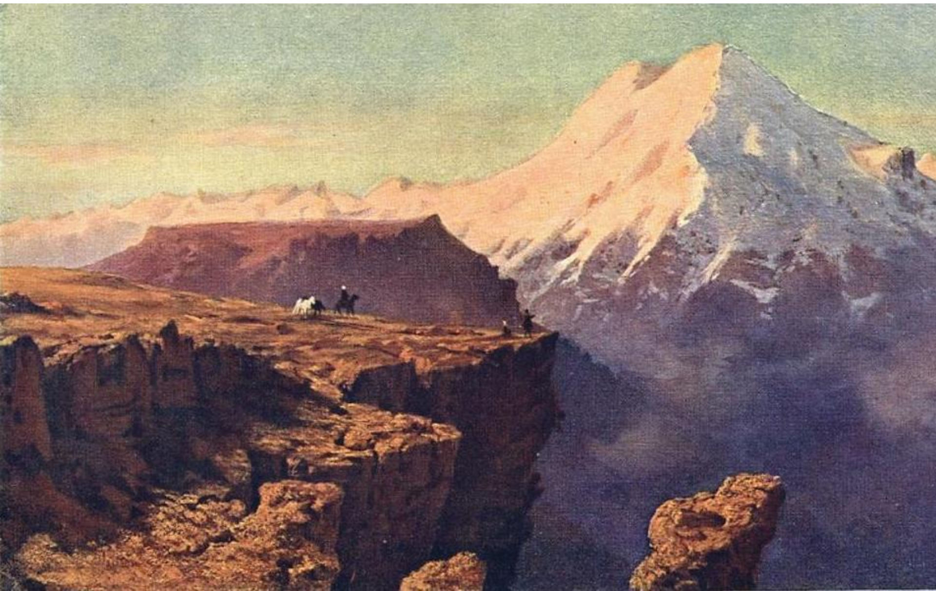
Кавказский вид с Эльбрусом. Масло. 1837