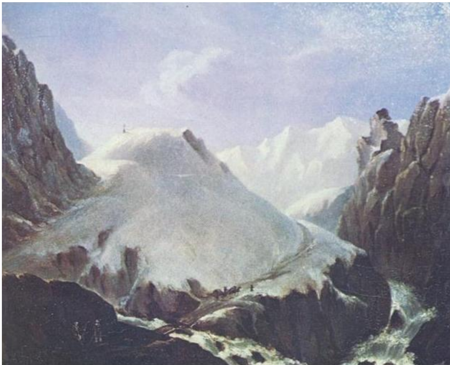
Крестовый перевал. Масло. 1837-1838