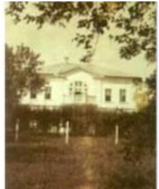
Открыл школу для бедных детей в Ясной Поляне