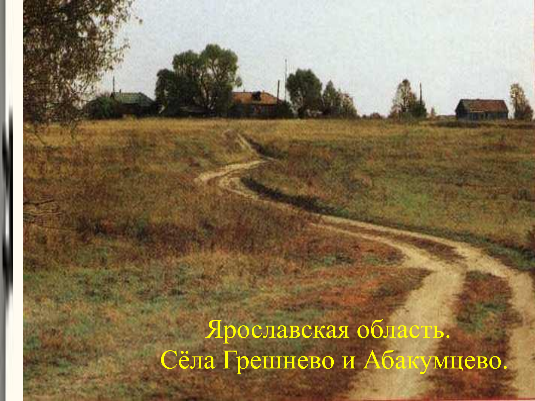
Ярославская область. Сёла Грешнево и Абакумцево.