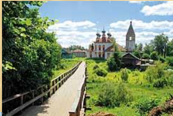
Почти центр города...

Ю.Манн, литературовед: «Сила «Ревизора» в том, что это особый город. Все нормы общежития, обращения людей друг к другу выглядят как повсеместные..Перед нами весь мир русской жизни, «вся Русь»