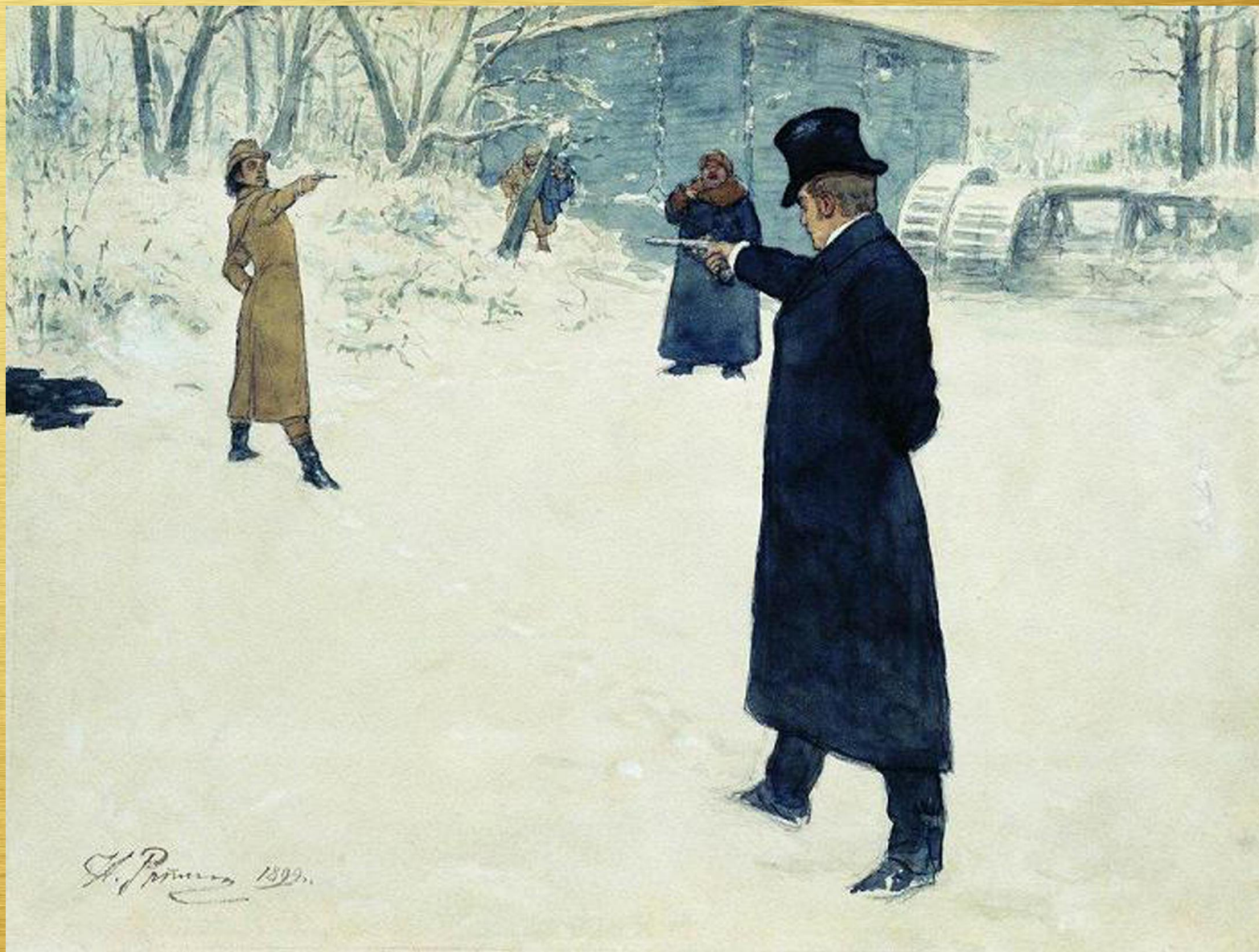
Илья Репин. Дуэль Онегина и Ленского. 1899 г.