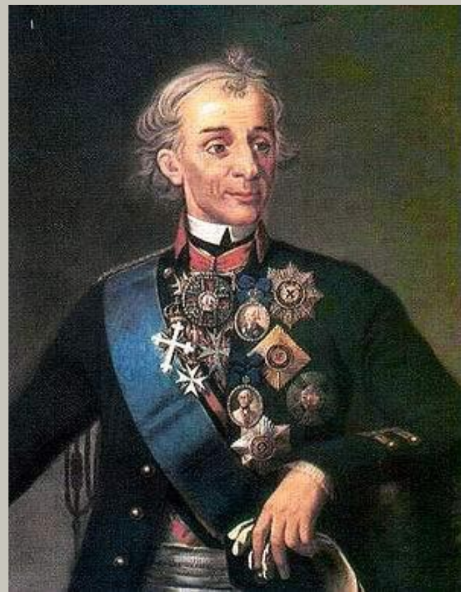
Александр Васильевич Суворов

великий русский полководец, не потерпевший ни одного поражения в своей военной карьере