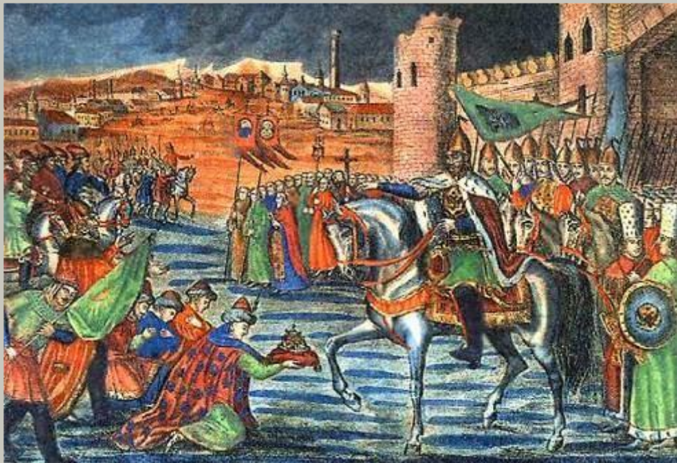
Взятие Казани Иваном Грозным