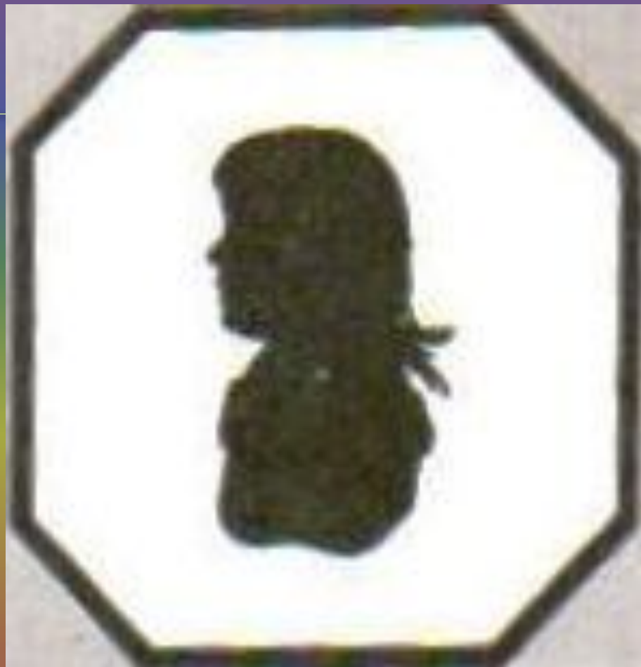
Мария Николаевна Волконская в детстве, мать Л.Н.Толстого.