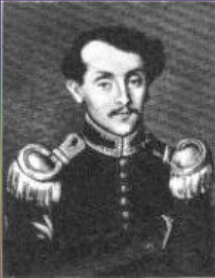
Николай Ильич, отец Л.Н.Толстого