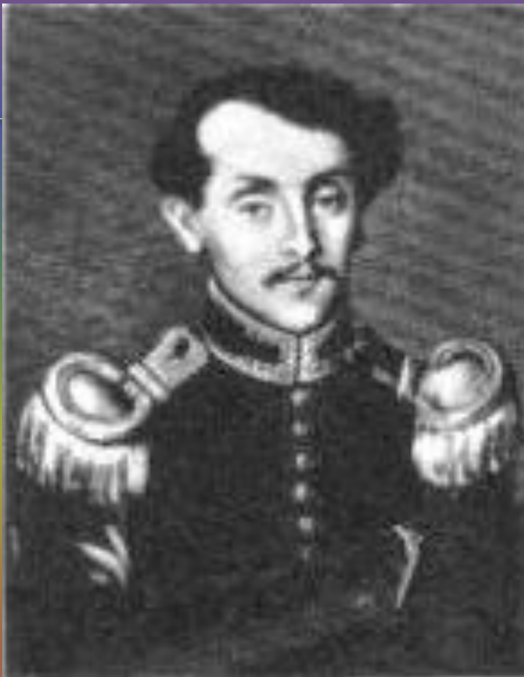
Николай Ильич, отец Л.Н.Толстого