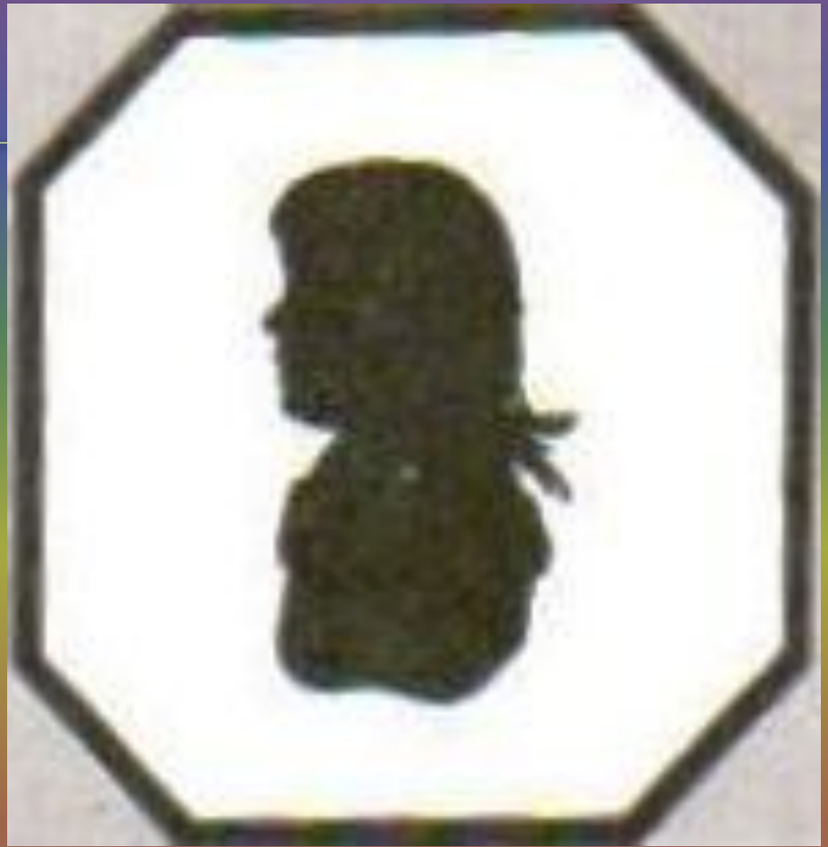
Мария Николаевна Волконская в детстве, мать Л.Н.Толстого.