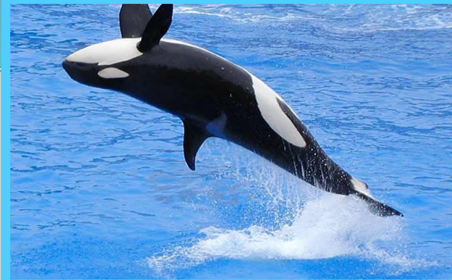
К осатка – водное млекопитающее семейства дельфиновых