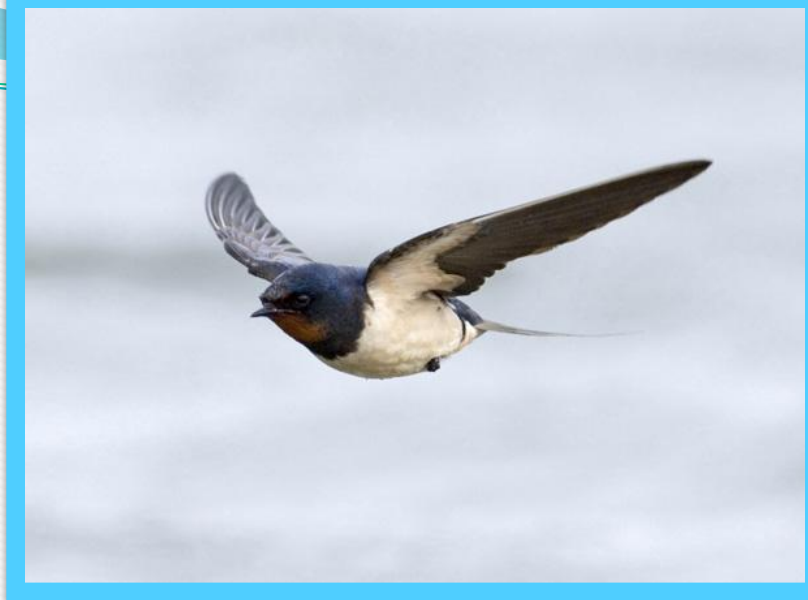
К асатка – деревенская ласточка