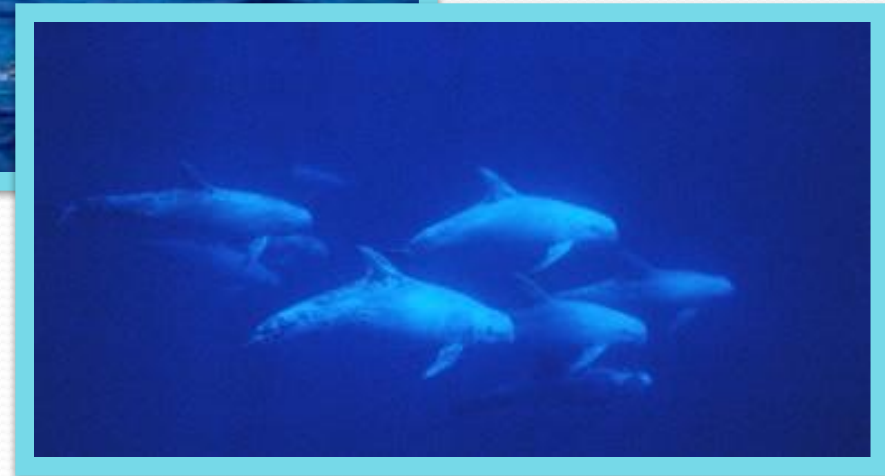
Серый дельфин (грампус)