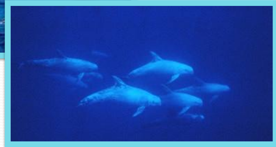
Серый дельфин (грампус)