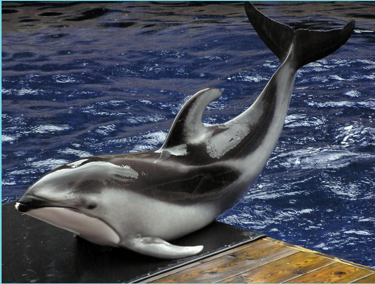
Дельфин – белобочка (или белобока)