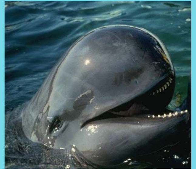
Гринда (шароголовый дельфин)