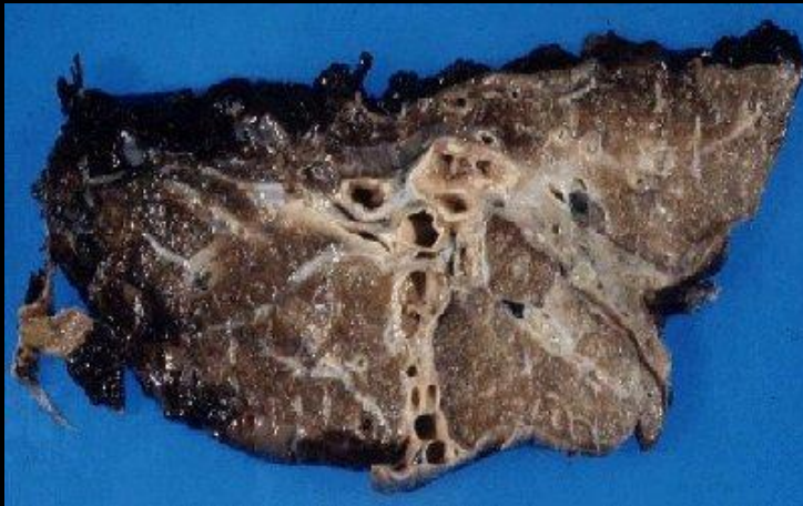
Фото органов при курении