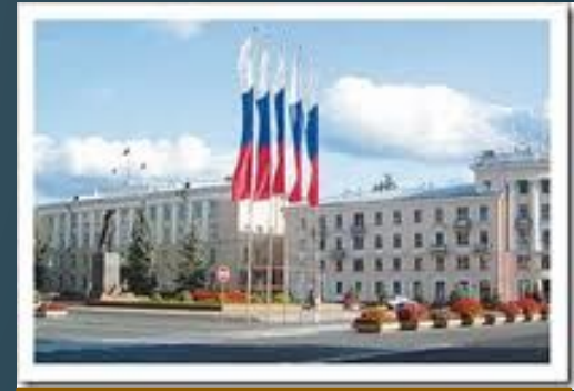
научно- исследовательские и проектные организации