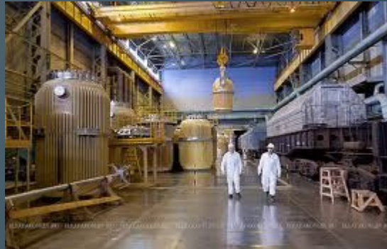
предприятия по переработке или изготовлению ядерного топлива