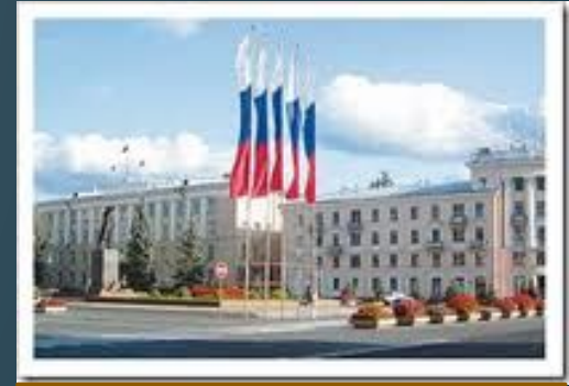
научно- исследовательские и проектные организации