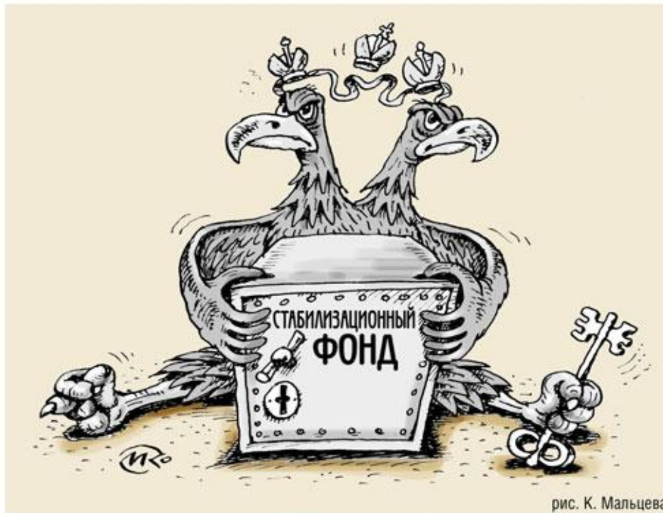
рис. К. Мальцева