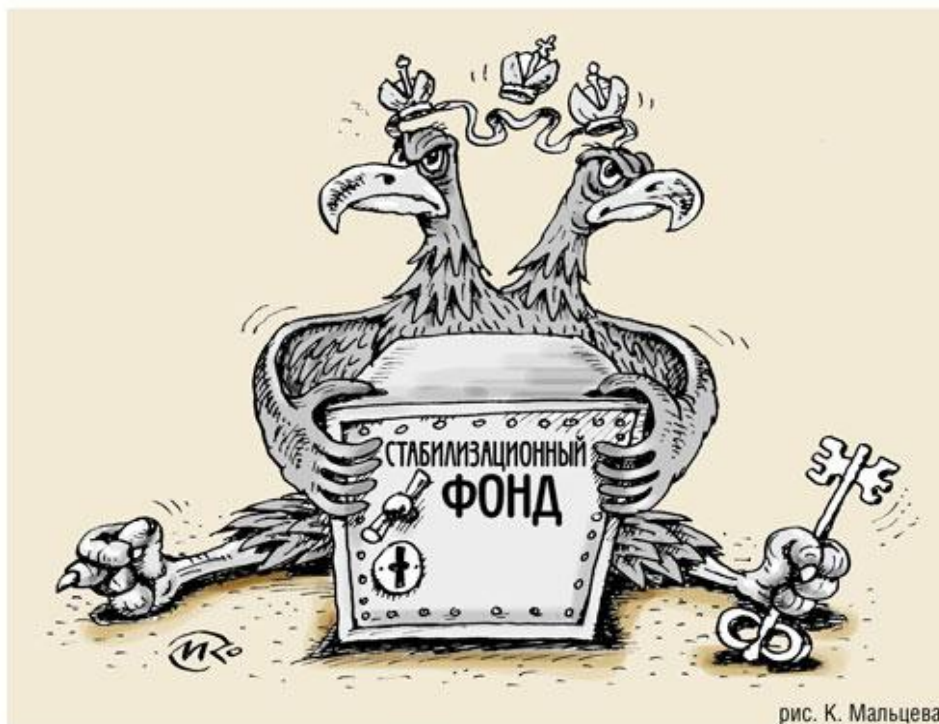
рис. К. Мальцева