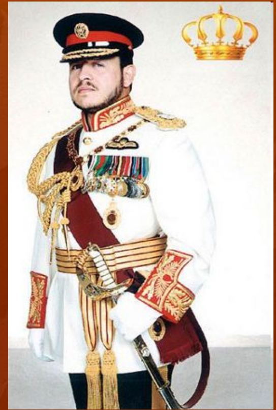
Король Иордании Абдалла 2