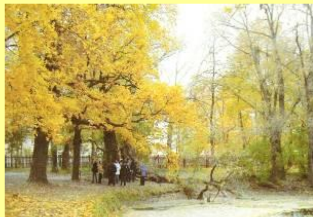
Древняя ветла – около 250 лет