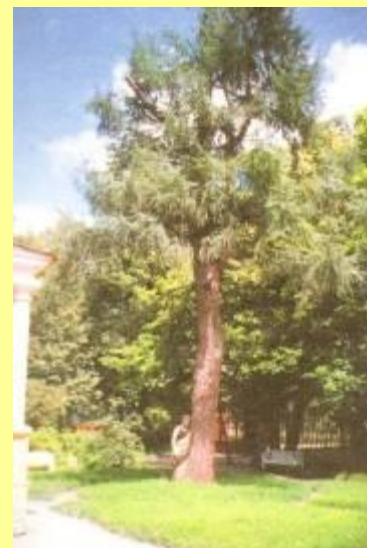
Лиственница, посаженная А. С.Пушкиным осенью 1833 г.