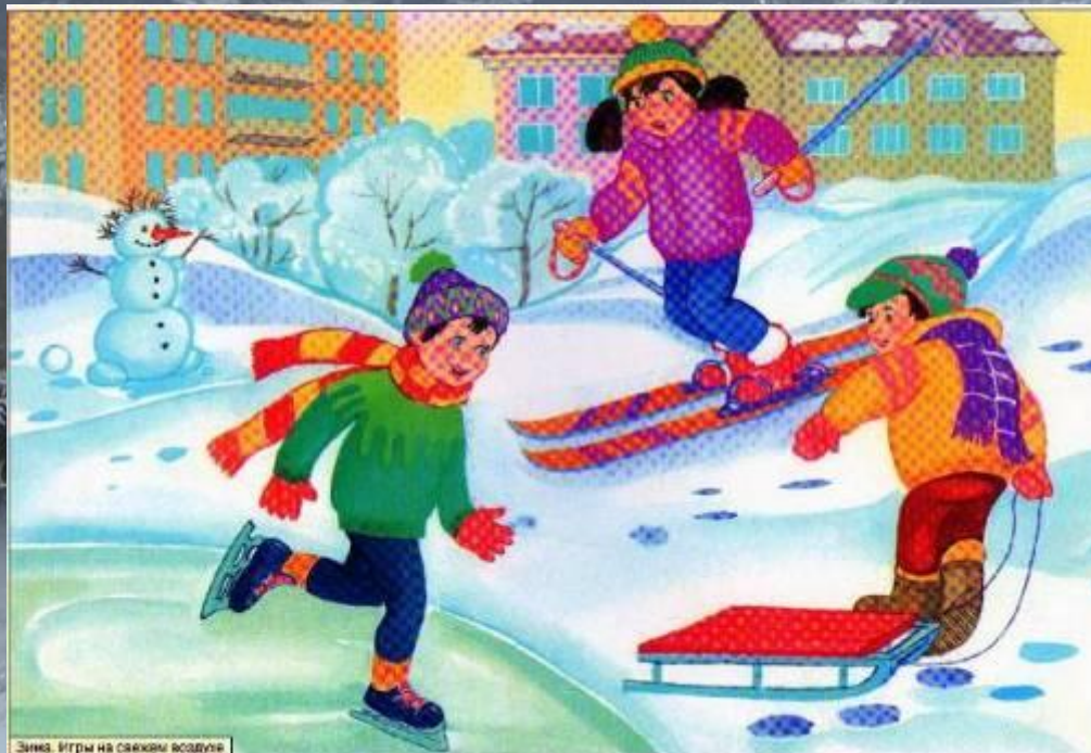
Зима. Игры на свежем воздухе