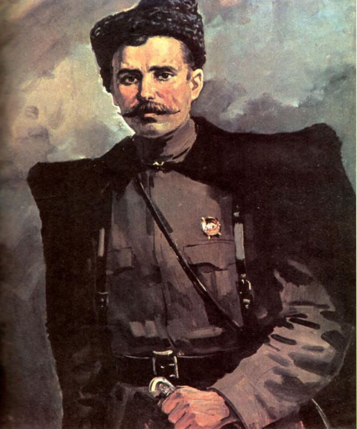
Василий Иванович Чапаев (1887-1919)