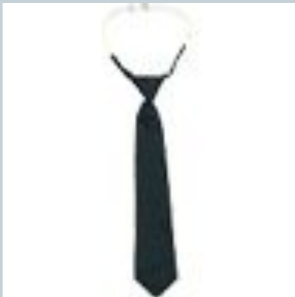
Галстук - регат