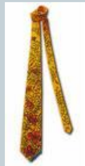
Галстук - самовяз