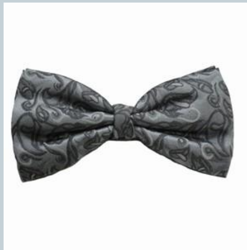
Галстук - бабочка