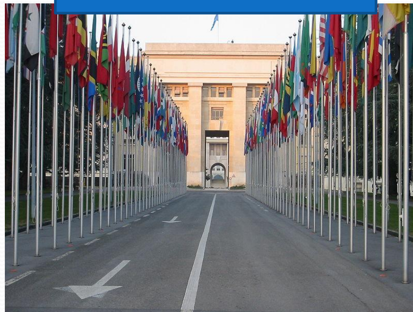
Флаги перед зданием ООН в Женеве