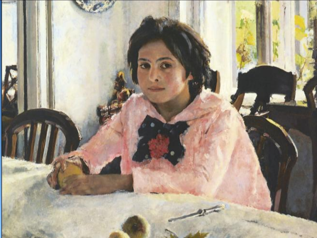
Девочка с персиками В.А.Серов