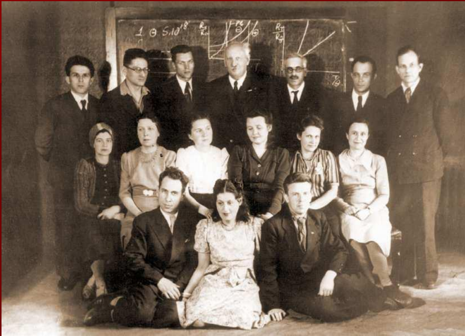
Иоффе с сотрудниками. 1930-е гг. Среди них: Ю. Дунаев, Б. Курчатов, В. Жузе, Б. Коломиец и А. Регель.