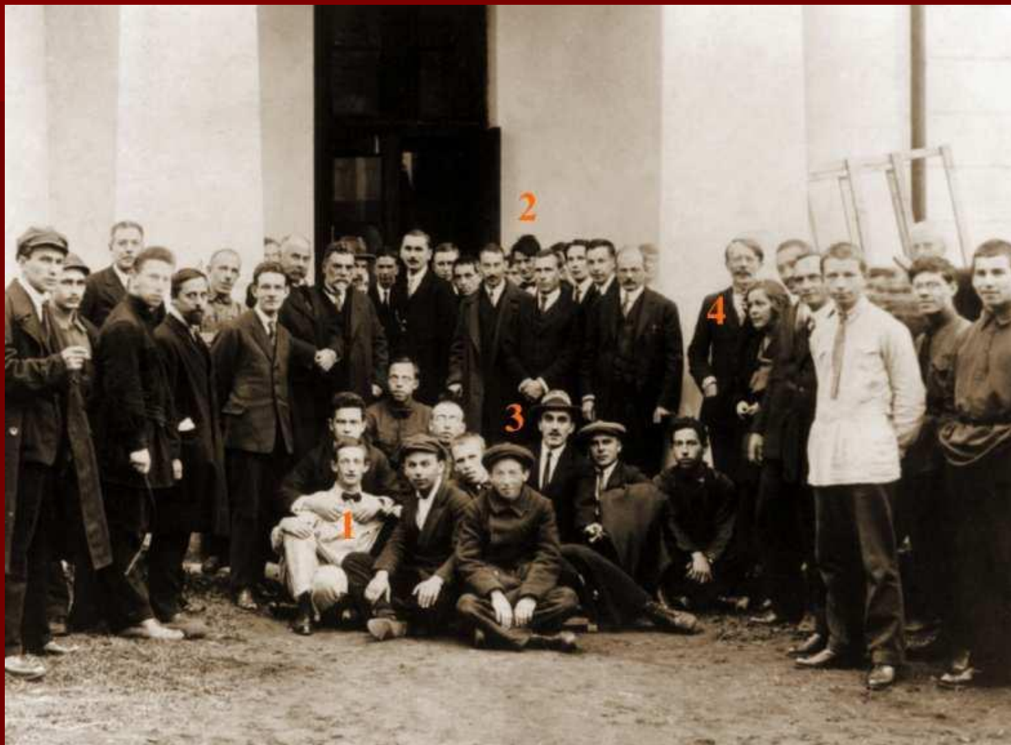
1—Ю.Б. Харитон, 2—И.В. Курчатов, 3—Н.Н.Семенов, 4—И.В. Обреимов

У главного входа в Физико- технический институт. 1925.