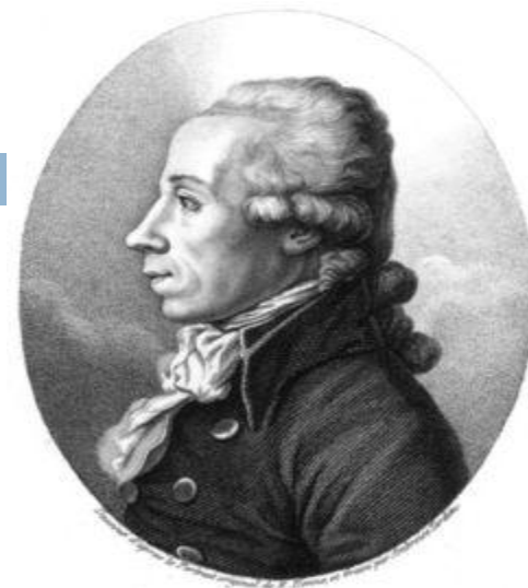
Мартин Генрих Клапрот

В свободном виде стронций первым выделил английский химик и физик Гемфри Дэви в 1808. Металлический стронций был получен при электролизе его увлажненного гидроксида. Выделявшийся на катоде стронций соединялся с ртутью, образуя амальгаму. Разложив амальгаму нагреванием, Дэви выделил чистый металл.