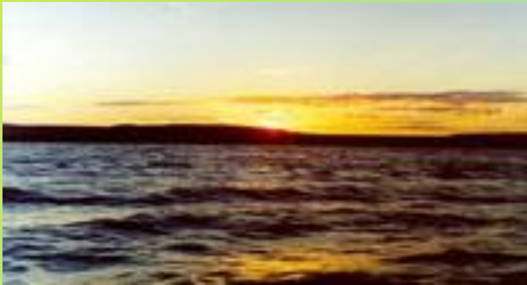
Закат на озере Таймыр

Крупнейшее озеро – Таймыр, к заповеднику относятся его заливы – бухта Ледяная, Байкуранеру, Байкуратурку. Другие значительные озёра – Сырутатурку, Надатурку, Дюдассаматурку