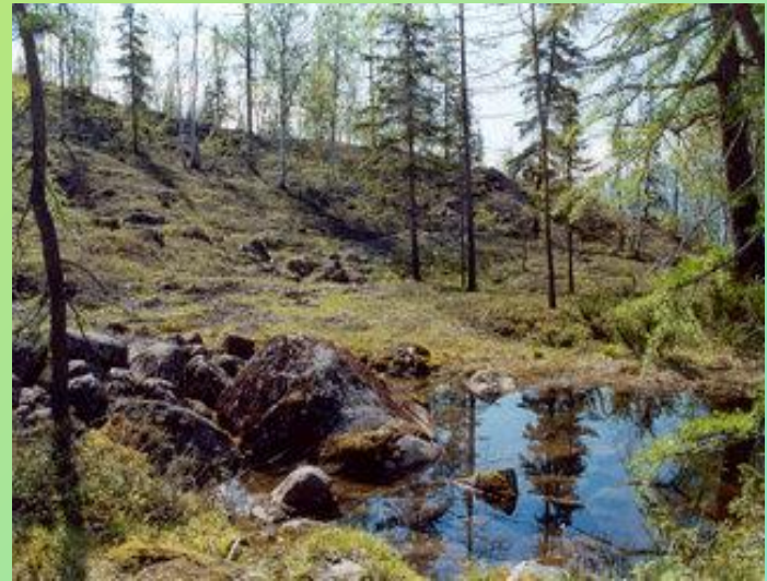
Самые северные в мире леса «Ары-Мас»