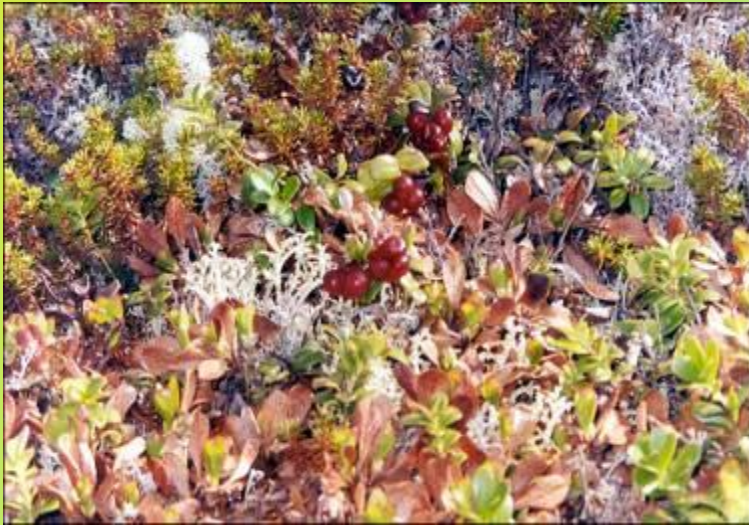
Растительность в тундре

На всей территории заповедника произрастает 429 видов сосудистых растений, 212 видов листостебельных мхов, 263 вида лишайников. Отмечено также 47 видов шляпочных грибов и 157 микромицетов.