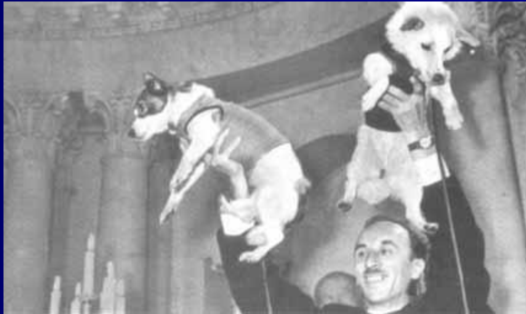
Белка и Стрелка после полёта .

Белка и Стрелка стали всеобщими любимцами. Их возили по детским садам, школам, детским домам. Журналистам на пресс-конференциях давали возможность собачек потрогать, но предупреждали: как бы ненароком не цапнули.