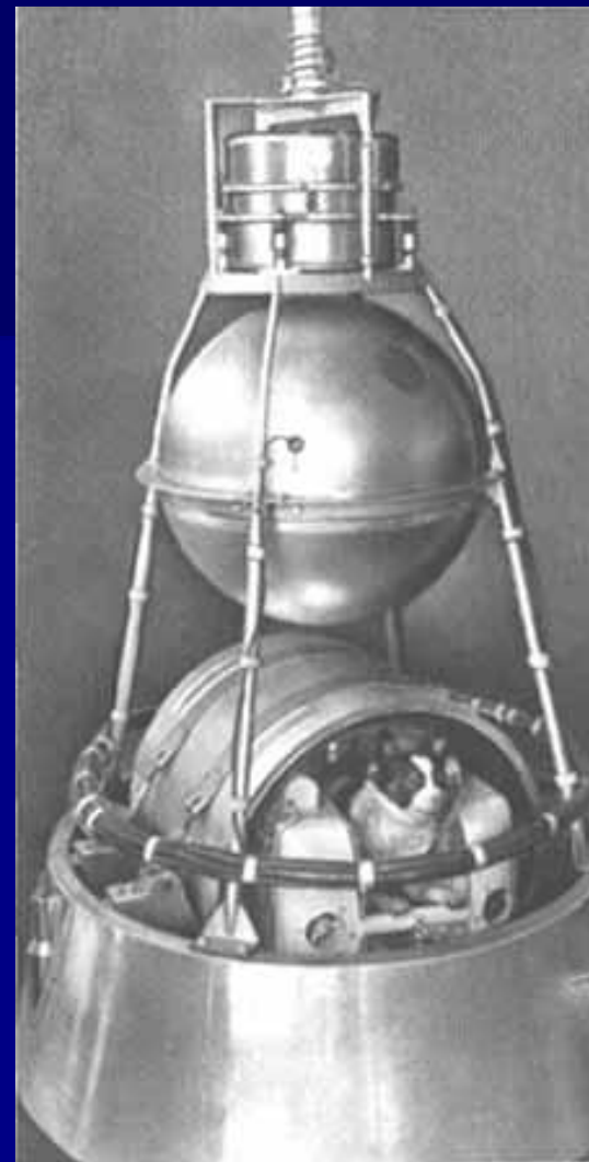
Второй искусственный спутник земли с собакой на борту.