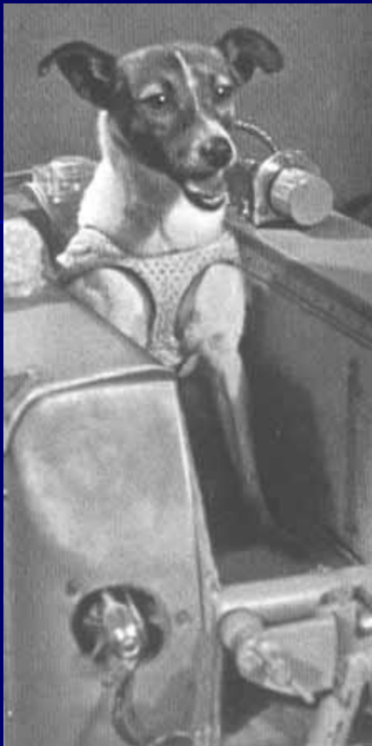
Таким был жилой отсек космической собаки.