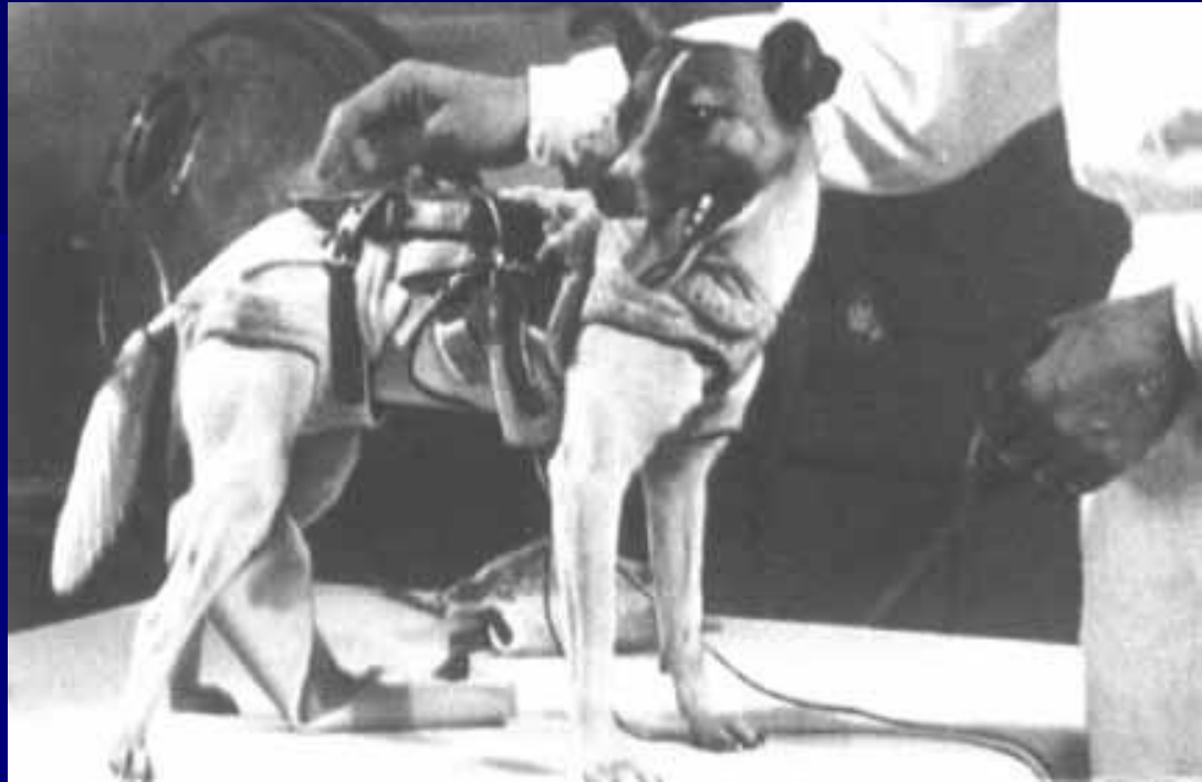
Биокосмонавт Лайка перед полетом в космос.

Животных для нужд космонавтики стали использовать очень рано. Уже на втором советском спутнике, запущенном 3 ноября 1957 года, находилось живое существо – собака Лайка. В то время люди ещё очень мало знали о космосе, а космические аппараты ещё не умели возвращать с орбиты. Поэтому Лайка навсегда осталась в космическом пространстве.