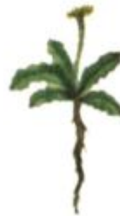
выращен в горах