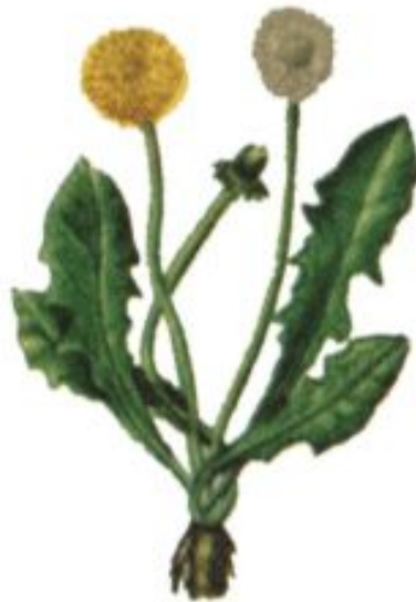
выращен на равнине

Изменчивость одуванчика, выращенного из одного корня