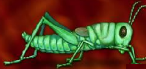
Поздняя стадия имаго