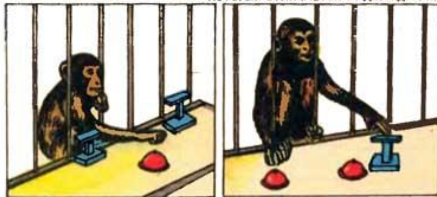
ЖИВОТНЫЕ УЧАТСЯ ВЫБИРАТЬ ИЗ ТРЕХ ПРЕДМЕТОВ ТОТ, КОТОРЫЙ ОТЛИЧАЕТСЯ ОТ ДВУХ ДРУГИХ