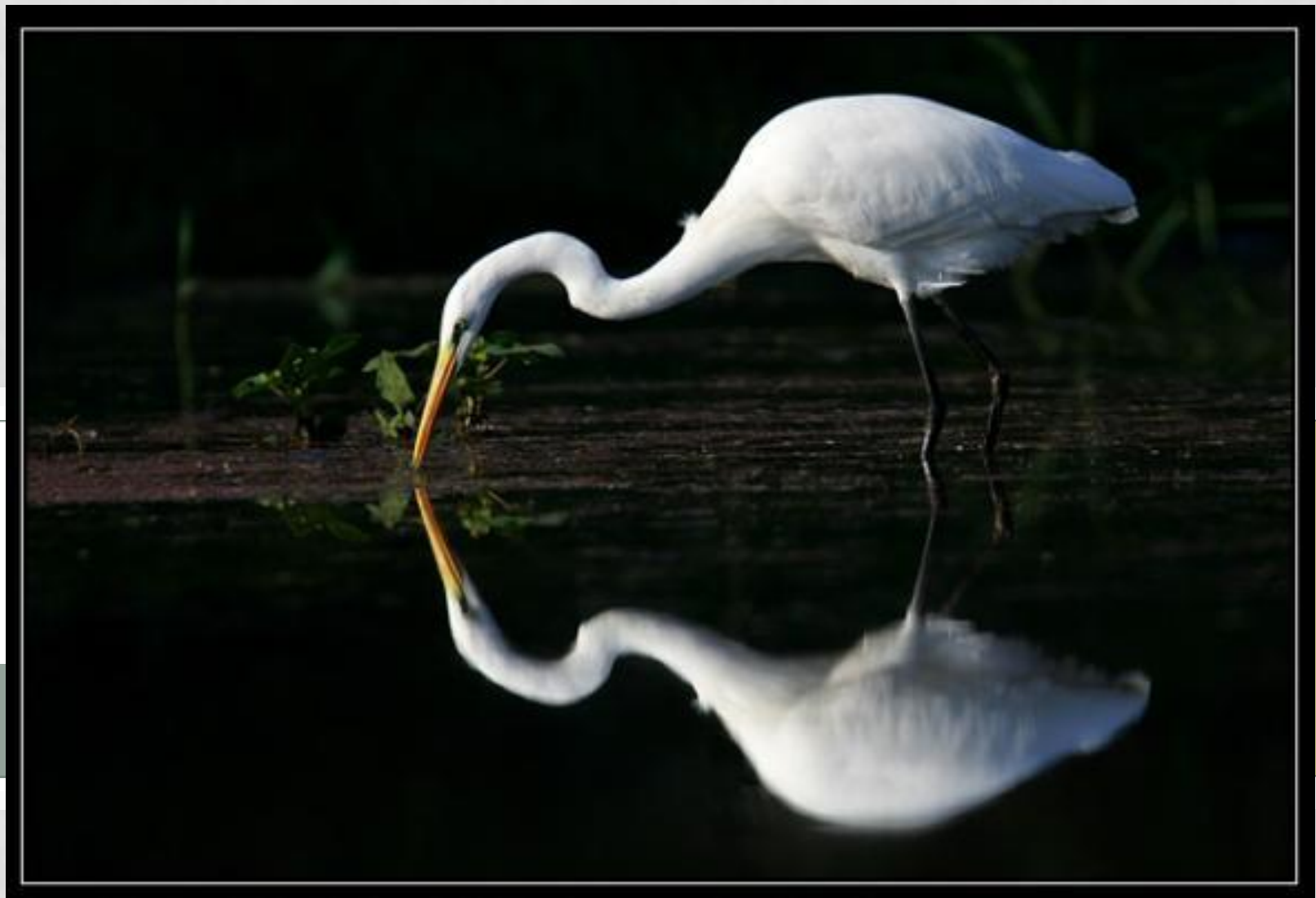
БОЛЬШАЯ БЕЛАЯ ЦАПЛЯ.