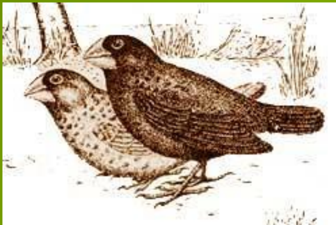
Большой земляной вьюрок