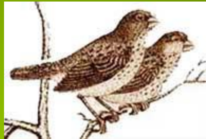
Толстоклювый древесный вьюрок