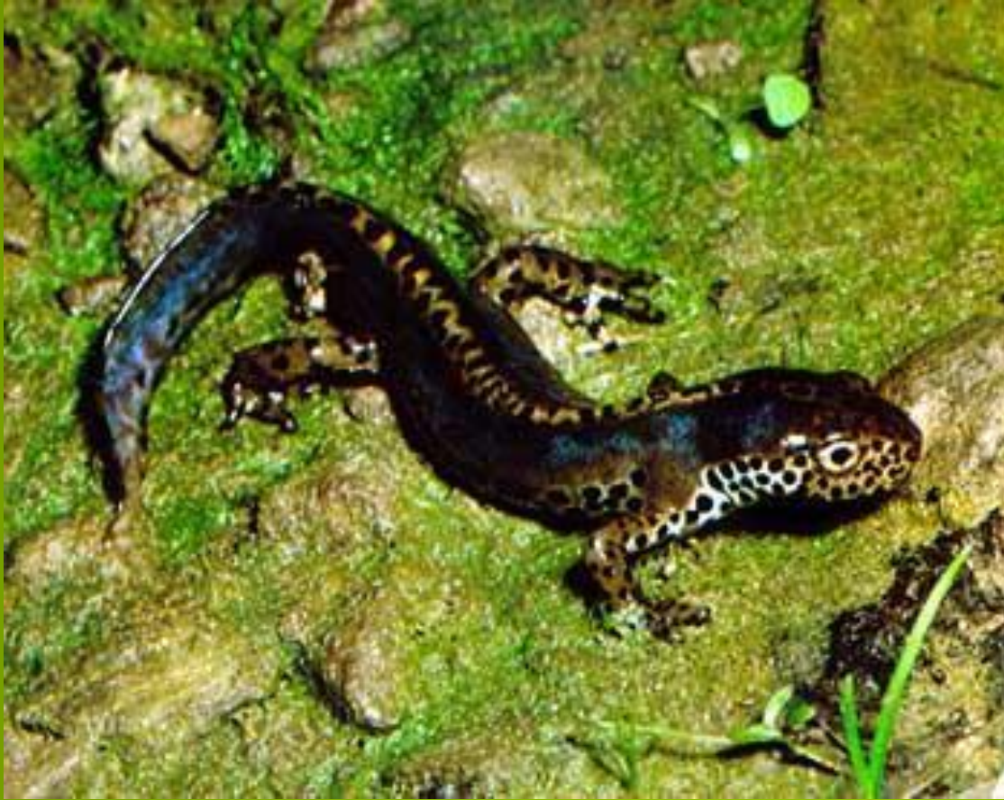
Тигровая саламандра Ambystoma sp.