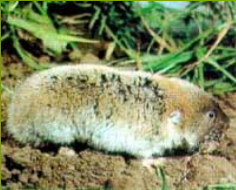
Слепушонка Ellobius talpinus