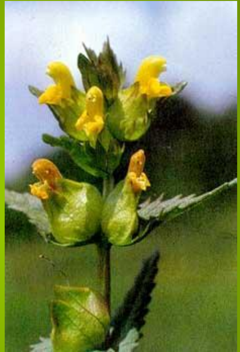
Большой погремок Alectorophus major