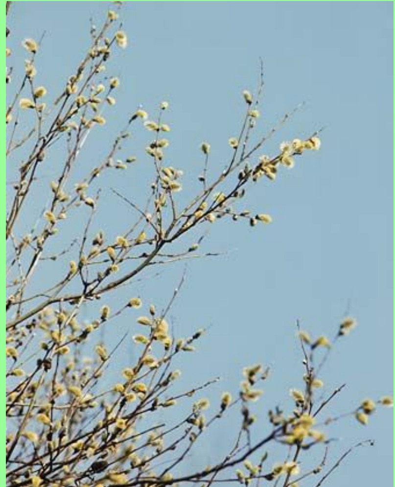
Ива. Мужские цветы