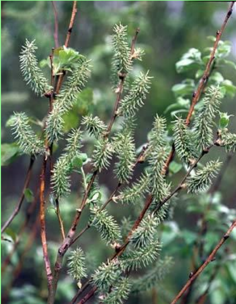
Ива. Женские цветы