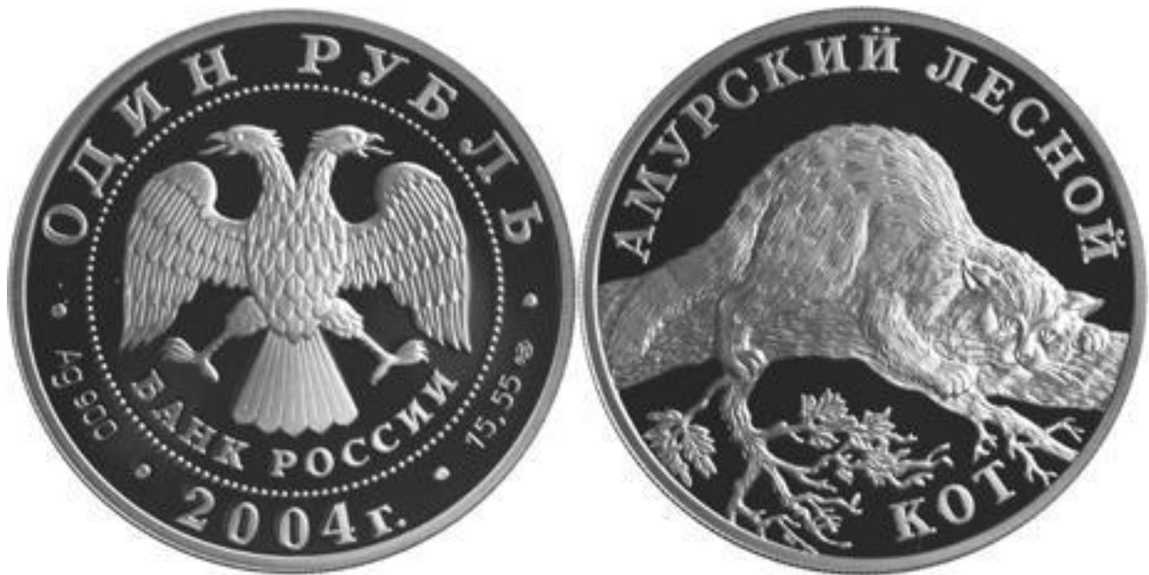
Монета Банка России — Серия: «Красная книга», Амурский лесной кот, 1 рубль