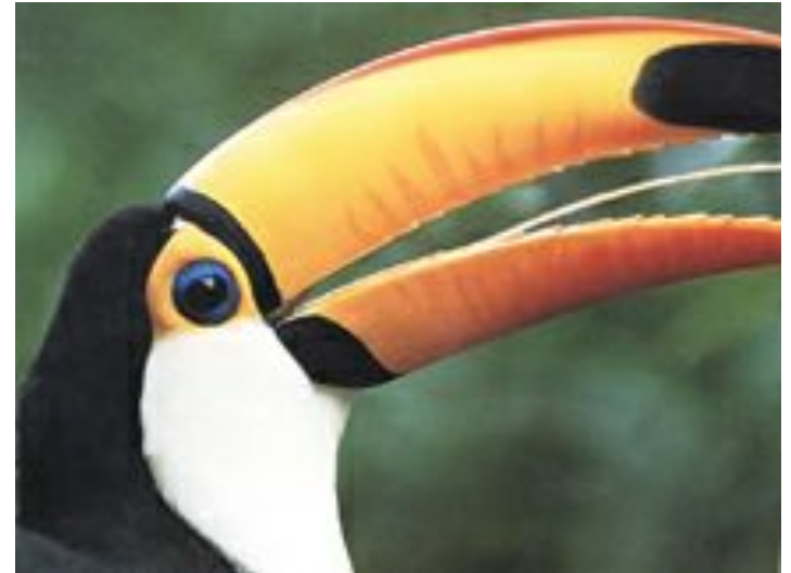
Перцеед токо ( Ramphastos toco ).