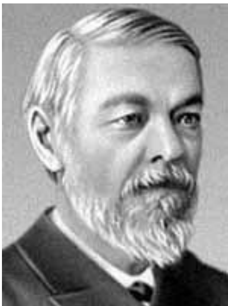
И. М. Сеченов