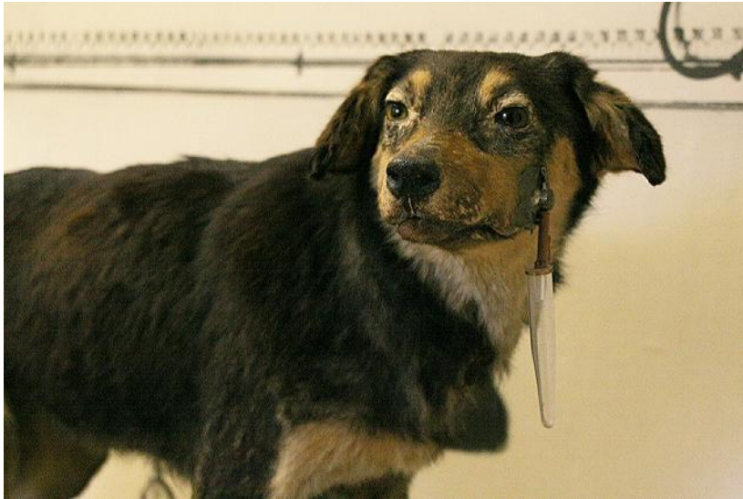
Собака Павлова, Музей Павлова, 2005

В Мадридском докладе, сделанном на русском языке, И. П. Павлов впервые сформулировал принципы физиологии высшей нервной деятельности, которой он и посвятил последующие 35 лет своей жизни. Такие понятия как подкрепление, безусловный и условный рефлекс, стали основными понятиями науки о поведении