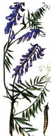
Семена вики (мышинного горошка)