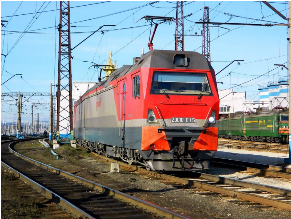
Электровоз постоянного тока