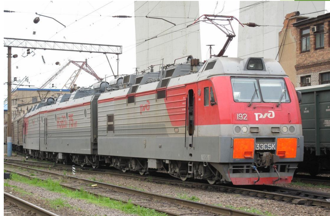
Электровоз переменного тока