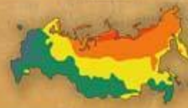
СТЕПЕНЬ БЛАГОПРИ- ЯТНОСТИ ПРИРОДНЫХ УСЛОВИЙ ЖИЗНИ НАСЕЛЕНИЯ