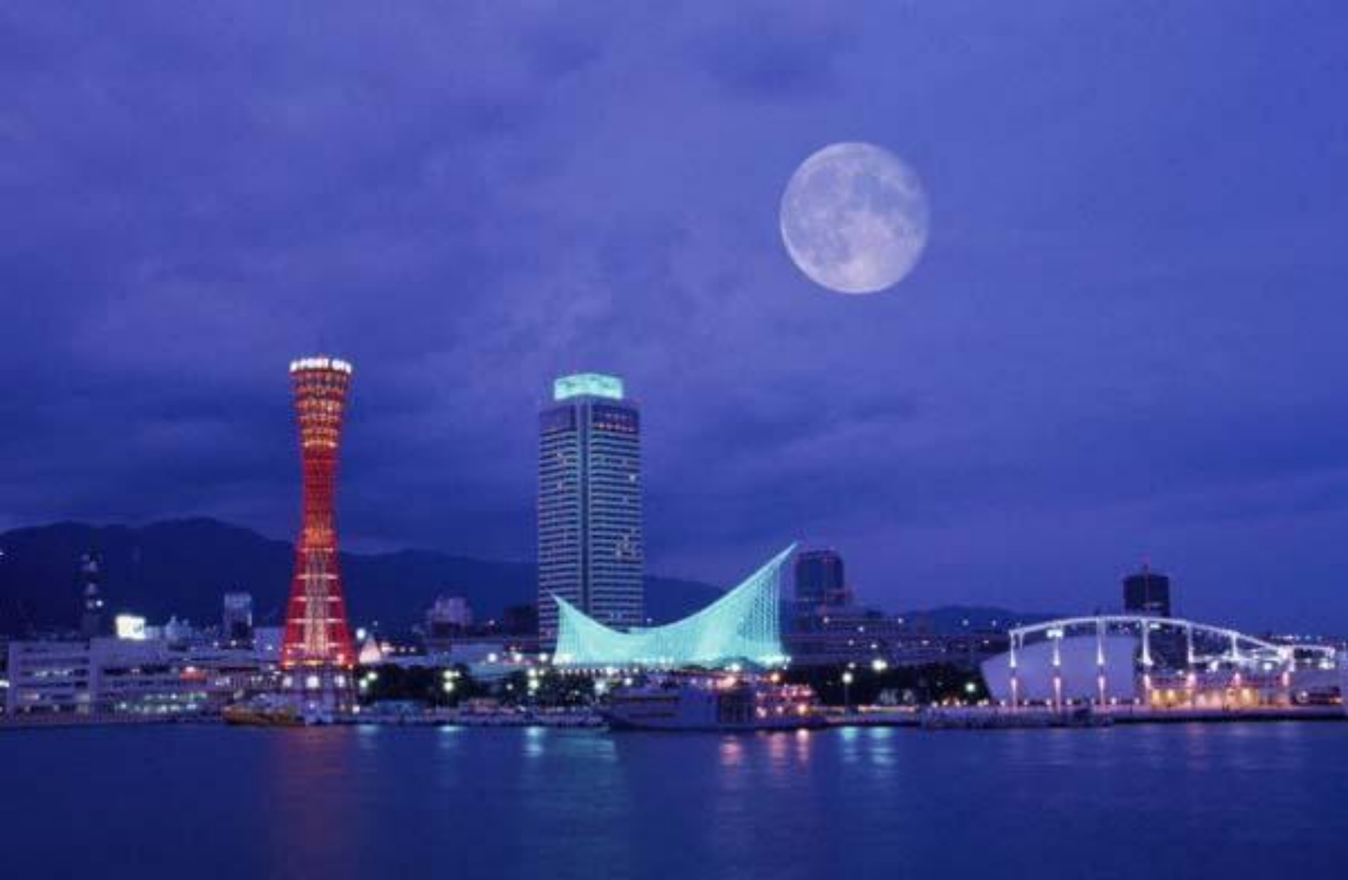
Япония. Город Кобе