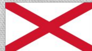
Флаг Св.Патрика Ирландия