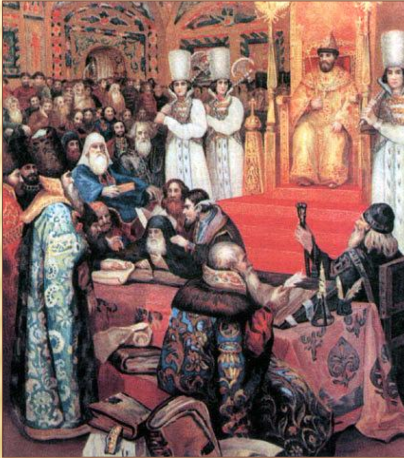
Н.Ф. Некрасов Составление Соборного уложения при царе Алексее Михайловиче