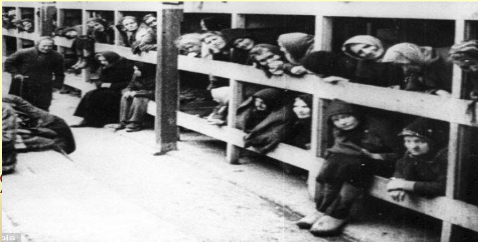
Холодные баракы с деревянными двухъярусными нарами