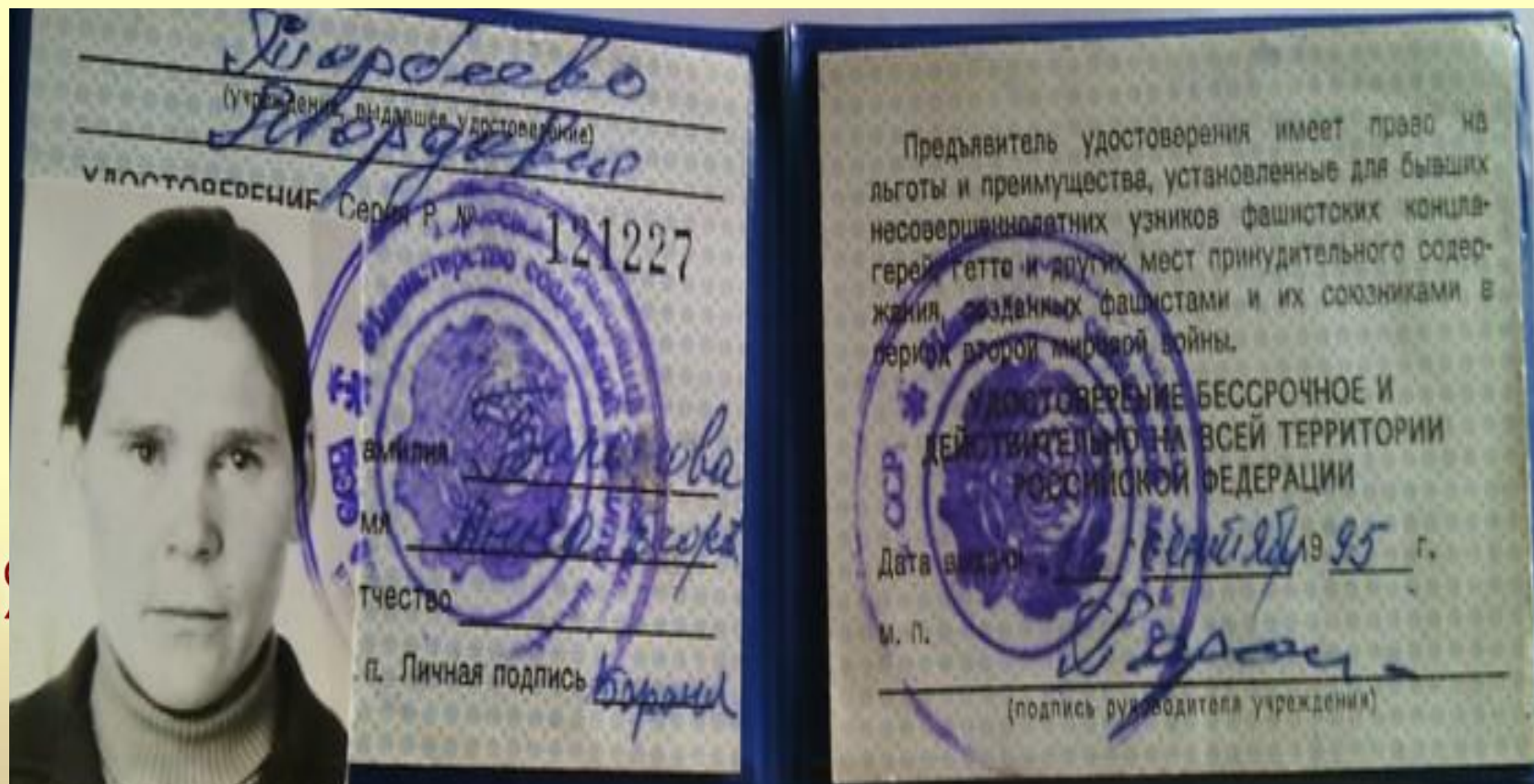
Удостоверение малолетнего узника фашистских концлагерей