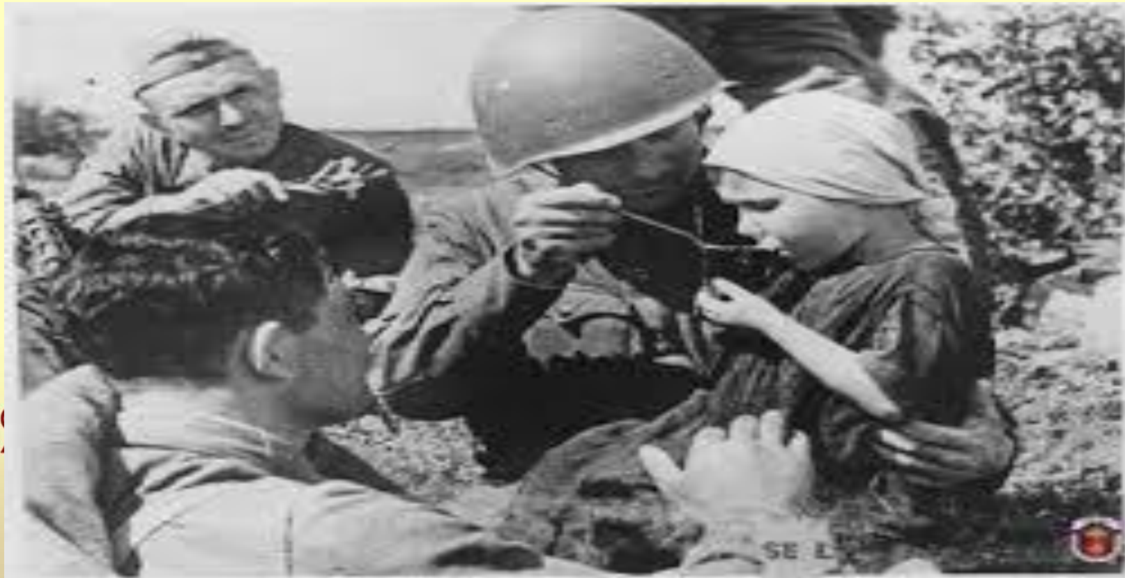
Русский солдат кормит ребенка