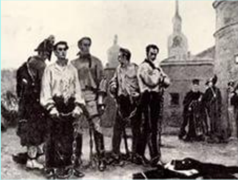
П.И.Пестель С.И.Муравьев-Апостол М.П.Бестужев-Рюмин Г.П.Каховский К.Ф.Рылеев

В январе началось следствие. Всего по делу проходило 579 человек. Причём следственные комиссии создали во многих полках. Виновными признали 289 человек. Из них 173 человека осудили. Самое жестокое наказание получили 5 заговорщиков: Павел Пестель, Кондратий Рылеев, Сергей Муравьев-Апостол, Михаил Бестужев-Рюмин и Пётр Каховский. Суд приговорил их к смертной казни четвертованием. Но затем это жуткое наказание было заменено повешением.