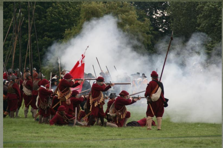
Сражение при Нейзби