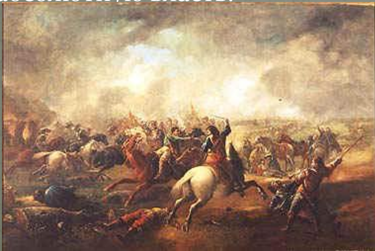
Бой при Марстон-Муре

Полководческий талант Кромвеля раскрылся в череде сражений, особенно в битве при Марстон-Муре (1644) . Его войска неизменно побеждали сторонников короля. Именно армия Кромвеля разбила Карла I в решающем сражении при Нейзби 14 июня 1645 года . Как лидер парламентской пуританской коалиции (также известной, как «круглоголовые» из-за коротко стриженных волос) и командир армии новой модели, Кромвель победил короля Карла I, положив конец притязаниям монарха на абсолютную власть.