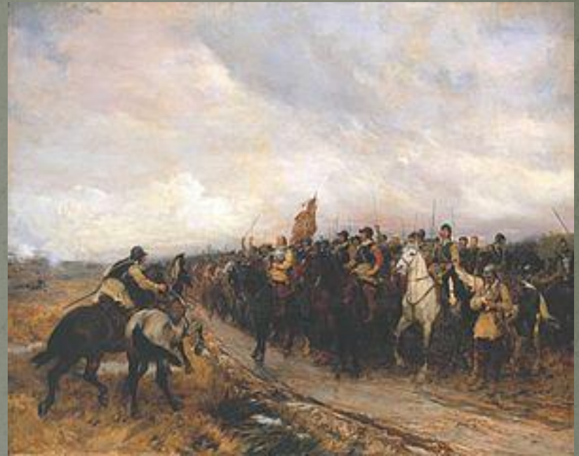
Кромвель в сражении при Данбаре

Он жестоко подавил восстания в Ирландии и Шотландии. Так, 3 сентября 1650 года в битве при Данбаре была разбита шотландская армия, почти вдвое превышающая по численности силы англичан. Ровно через год, 3 сентября 1651 года, англичане под стенами Вустера под командованием Оливера Кромвеля одержали окончательную победу над шотландцами. Разделил страну на двенадцать военных губернаторств во главе с подотчётными лично ему генерал-майорами. Ввёл охрану главных дорог. Наладил систему сбора налогов. Деньги, причём немалые, на все преобразования он взыскал с побеждённых сторонников короля.