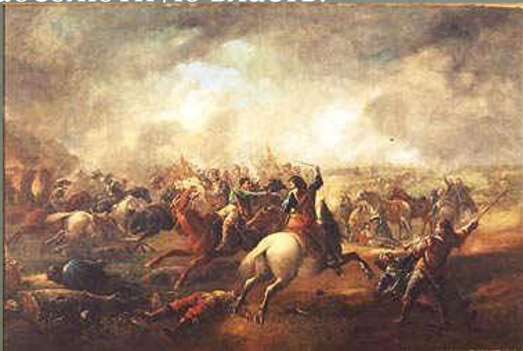
Бой при Марстон-Муре