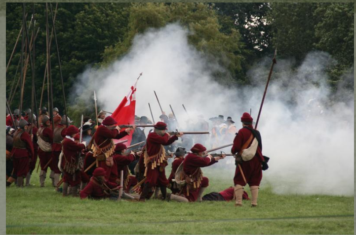
Сражение при Нейзби

Полководческий талант Кромвеля раскрылся в череде сражений, особенно в битве при Марстон-Муре (1644) . Его войска неизменно побеждали сторонников короля. Именно армия Кромвеля разбила Карла I в решающем сражении при Нейзби 14 июня 1645 года . Как лидер парламентской пуританской коалиции (также известной, как «круглоголовые» из-за коротко стриженных волос) и командир армии новой модели, Кромвель победил короля Карла I, положив конец притязаниям монарха на абсолютную власть.