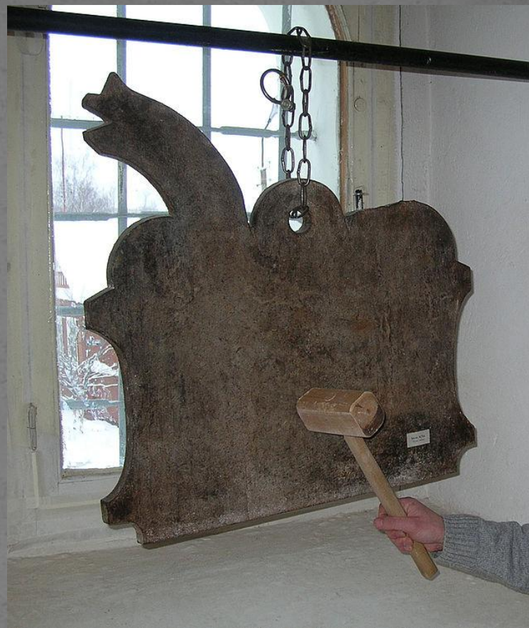
Металлическое било в экспозиции Старорусского краеведческого музея