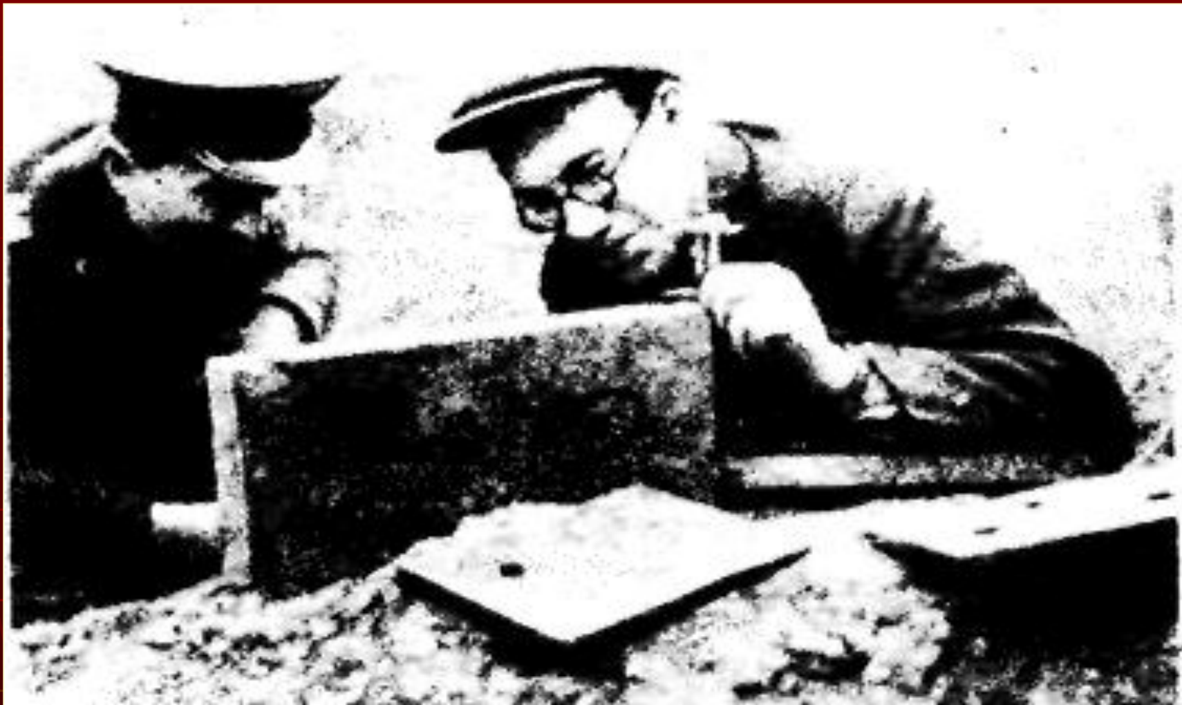
Академик М.А. Лаврентьев за изучением пробивного действия взрывчатых веществ 1944г.