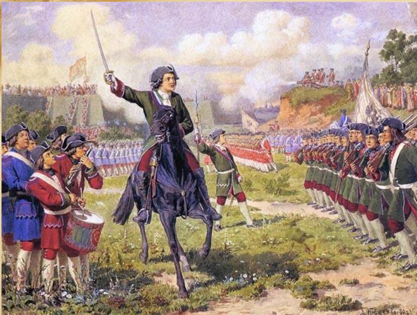
Игры потешных войск Петра I возле села Преображенское