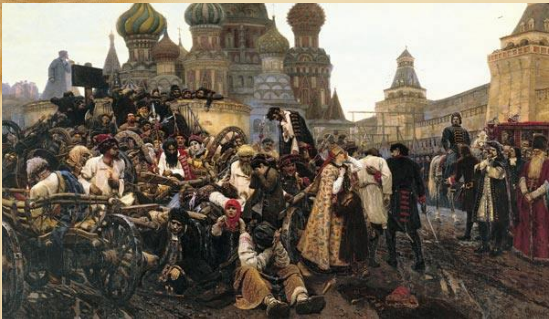
В.И.Суриков «Утро стрелецкой казни»