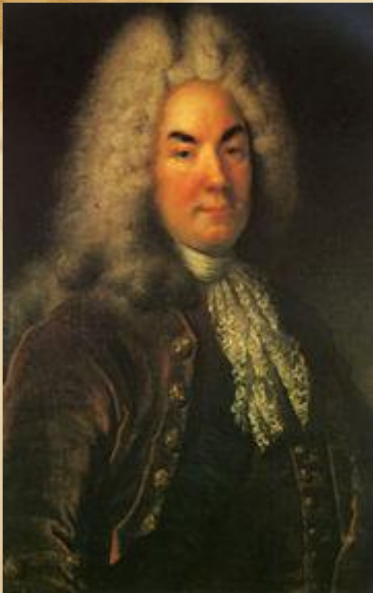
Петр Андреевич Толстой