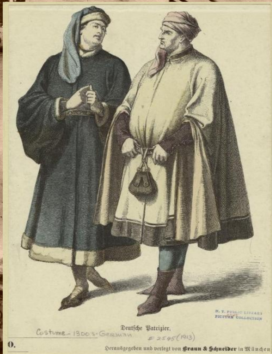
Deutsche Patrizier. Costume - 1300's - German # 2545 (1913)