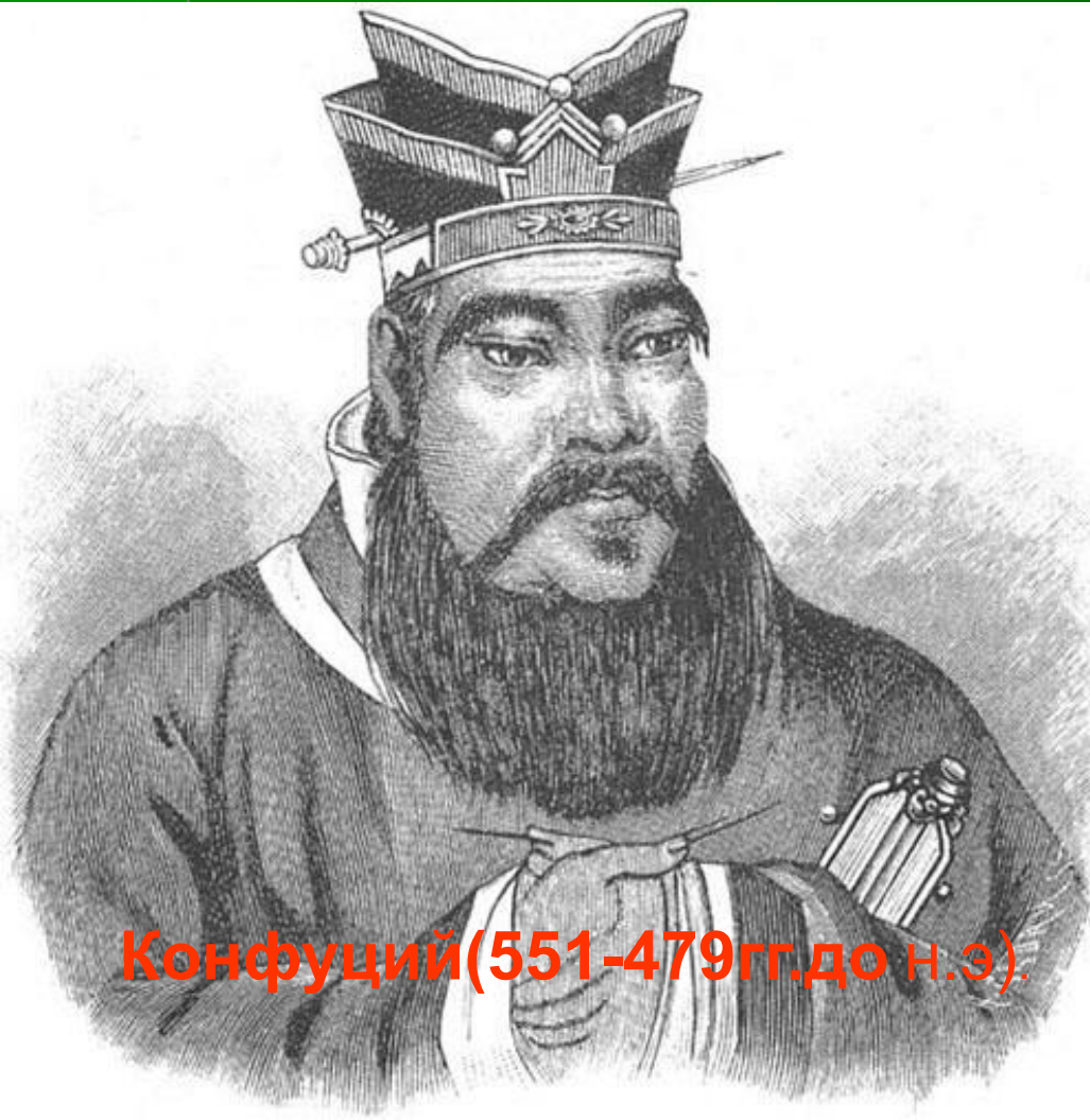
Конфуций (551-479 гг. до н.э.)